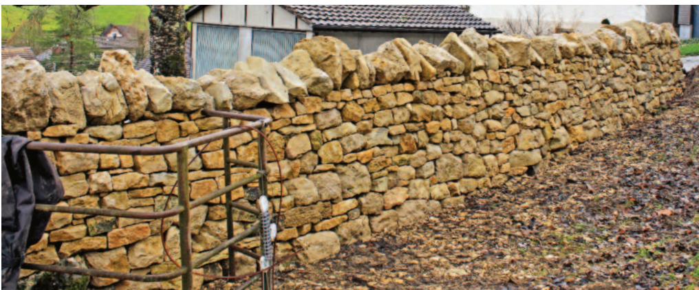
Les travaux sur les deux murs du pâturage du Droit, à Cormoret.

Une cinquantaine de mètres de murs en pierres sèches ont été restaurés sur le pâturage du Droit, à Cormoret, grâce à l'engagement de la bourgeoisie, de la commune, du Parc régional Chasseral et de plusieurs fondations. Confiés à la muretière Moussia de Watteville, elle-même épaulée par plusieurs confrères et des bénévoles, les travaux se sont étalés d'octobre à février.