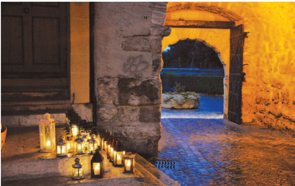
Les lanternes éclairent le chemin et rendent le décor magique