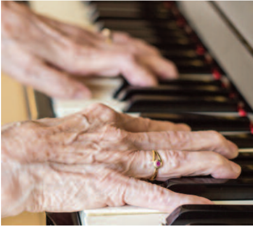
Les mains et les pieds se fragilisent avec l'âge. Apprenons à en prendre soin !

En vieillissant, nos corps subissent des changements qui peuvent affecter notre mobilité et notre confort au quotidien. Les mains et les pieds, en particulier, jouent un rôle essentiel dans notre autonomie, nous permettant d'effectuer des tâches variées, de la marche à la préhension d'objets.