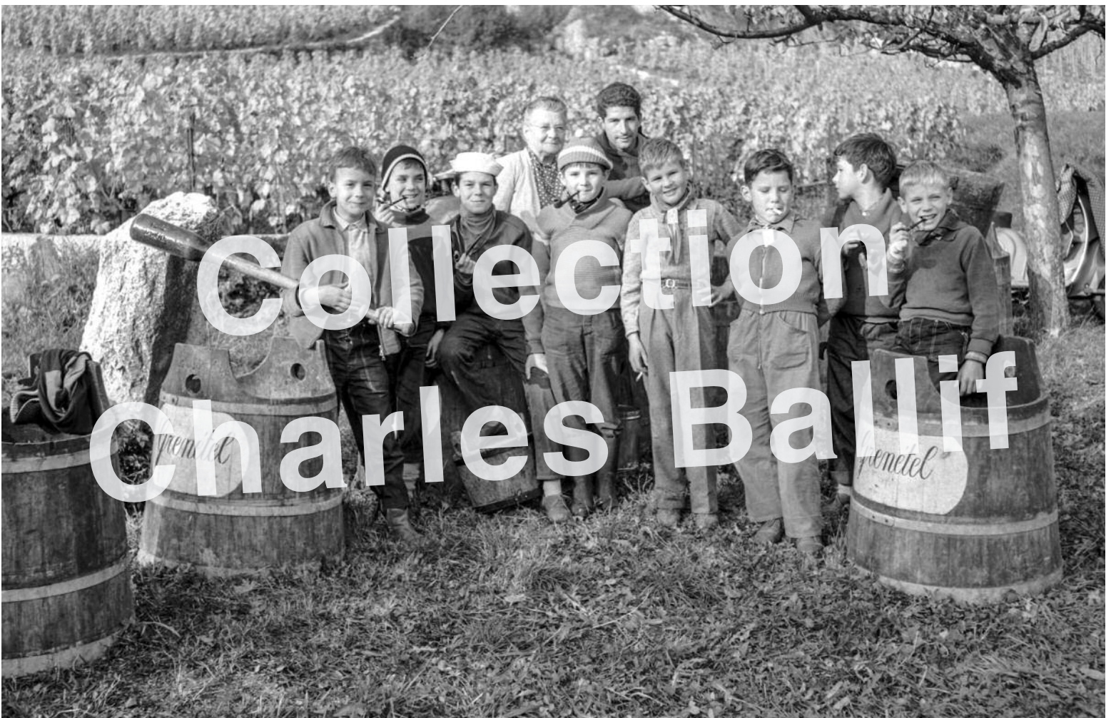
Le Landeron 1957, vendanges.