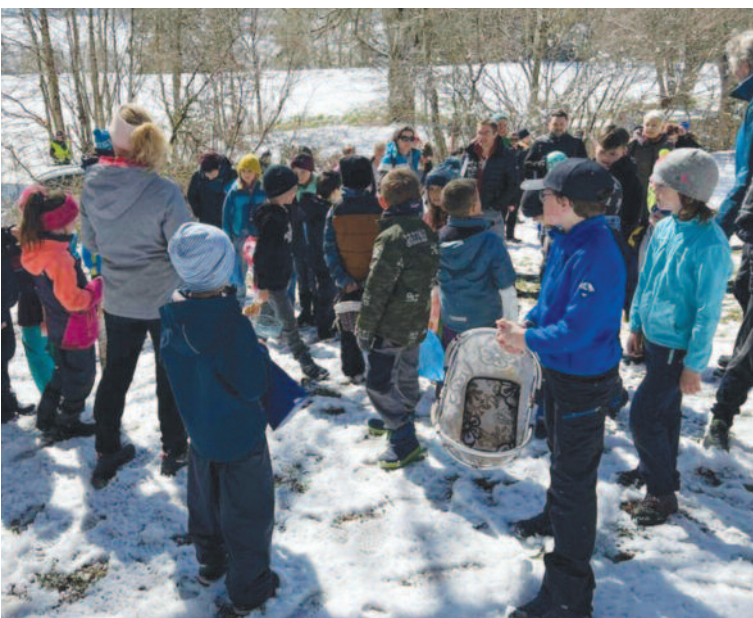
Y aura-t-il de la neige cette année à la chasse aux œufs ?

Le programme de la SDN figure sur le site de commune de Nods https://nods.ch