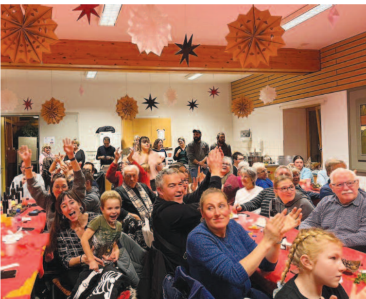
Les événements de la SDN se terminent généralement par un moment très convivial.