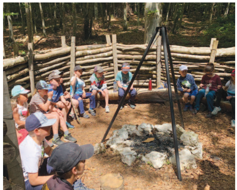
Le canapé forestier, un lieu idéal pour se restaurer.