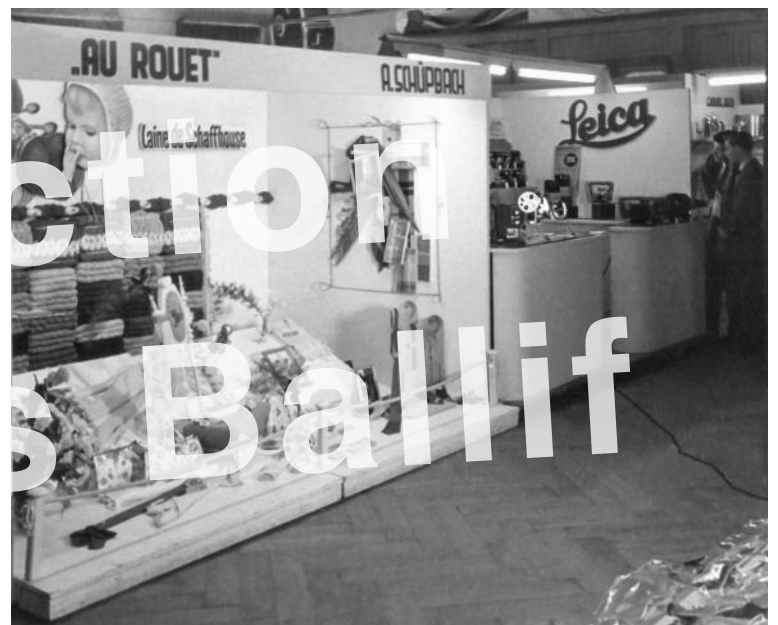
La Neuveville 1953, le comptoir neuvevillois à l'Hôtel du Faucon.