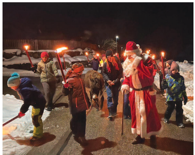
L'arrivée de Saint-Nicolas en terre niola, un moment fort de l'année.