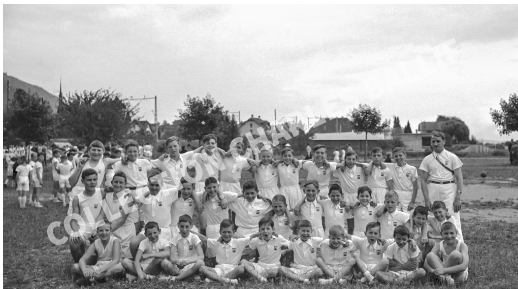
La Neuveville, 1936, Fête jurassienne de gymnastique - Section la Neuveville (collection Charles Ballif)