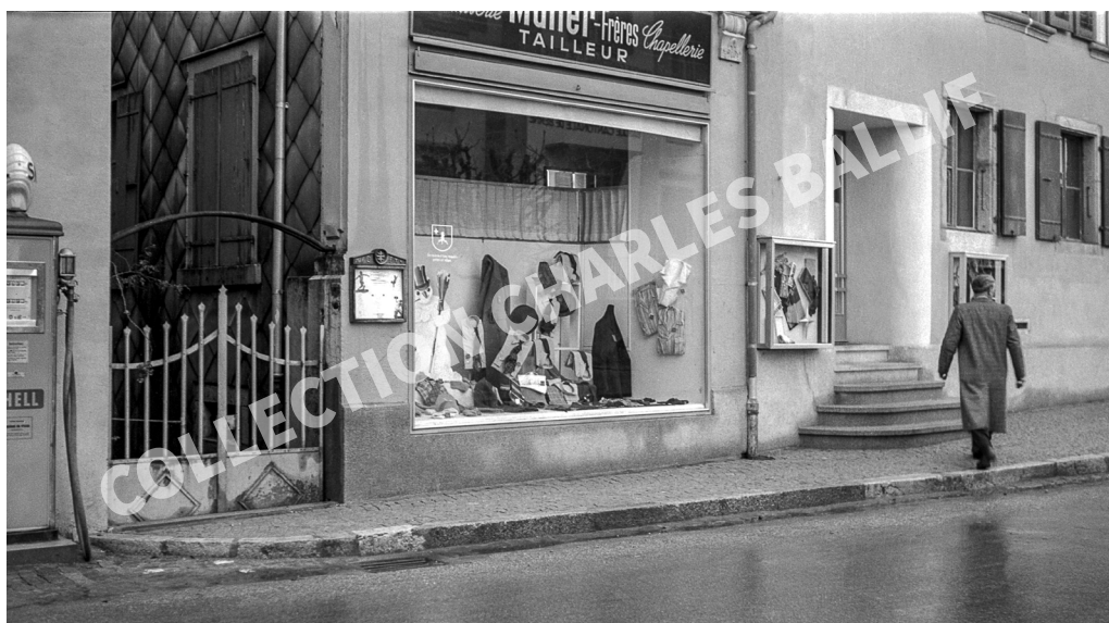
La Neuveville, 1948, Grand-Rue - Müller Frères - Tailleur - Cofection - Chapellerie