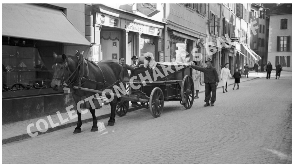
La Neuveville, 1940, Grand-Rue - Inauguration du char à ordures