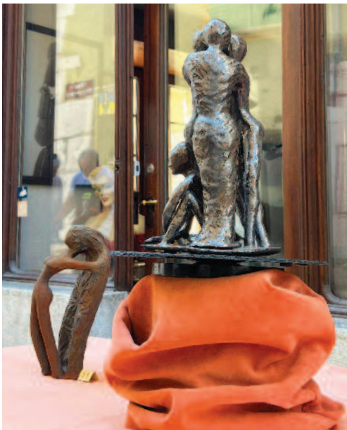
Une sculpture donnée au regard, de l'amour