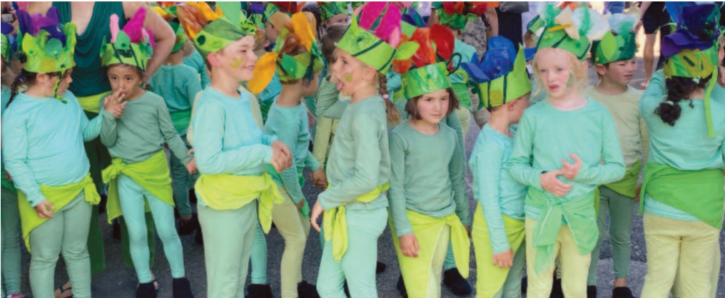
Les plus petits ont paradé en tête du cortège

Elisant domicile à La Neuveville dès le week-end dernier et jusqu'au 18 juin, le festival Usinesonore a littéralement déployé ses fastes sur le Pré de la Tour, débordant dans toute la ville, foisonnant d'impressions, d'émotions et de moments forts. Une réussite sur toute la ligne.