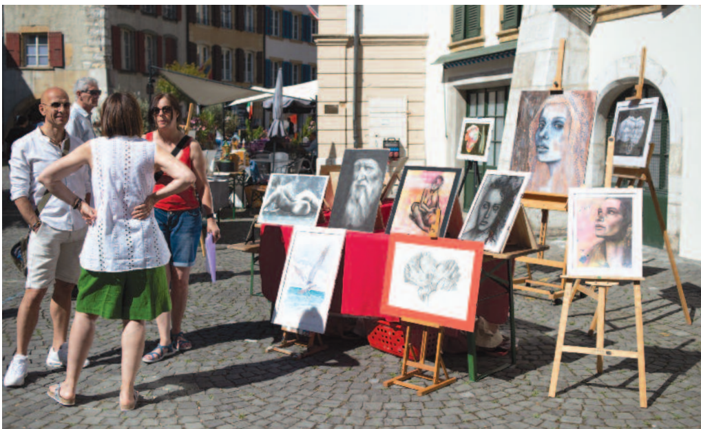
Le Marché des artistes, une exposition à ciel ouvert où la peinture prédominait