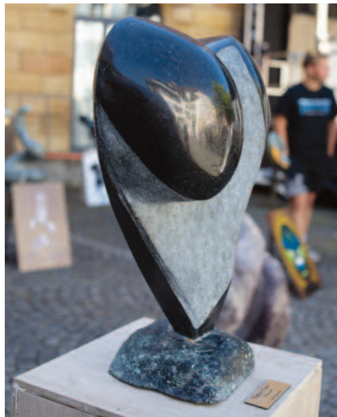
Un stand regorgeant de sculptures originales

"Nous avons envie de rendre l'art encore plus accessible, et d'offrir vitrine non seulement à nos artistes locaux, mais également régionaux, en leur proposant un espace qu'ils pouvaient aménager à leur guise."