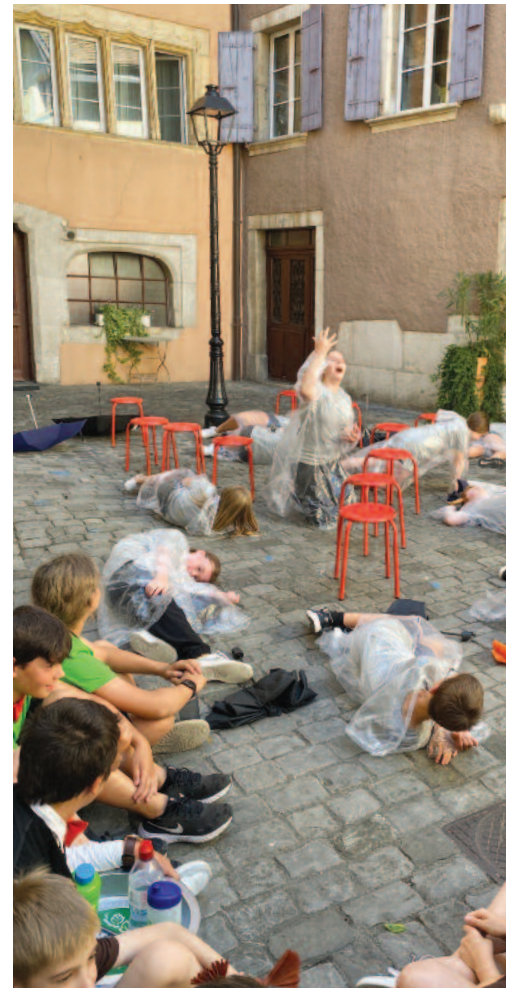
Les 6 et 7H sur leur scène improvisée

Créativité aurait pu être le maître mot de ce week-end, si la fragilité n'avait été le thème choisi par Usinesonore pour sa 8 e édition. Des fragilités qui ont été revisitées sous les formes les plus diverses. Des sonorités nées d'étranges corrélations lumineuses du Québécois Martin Messier qui a ouvert les feux vendredi soir en proposant au public une création inédite