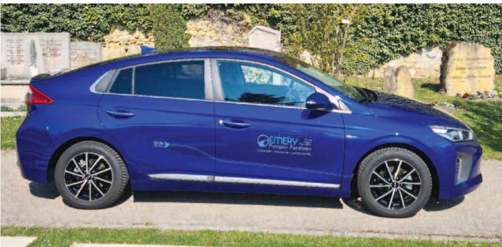
Le nouveau véhicule électrique permet les déplacements dans tout le canton et bien plus loin

Après avoir retiré de l'assortiment les capitonnages en viscosse pour les remplacer par du coton et échangé les poignées de cercueils en plastique par des poignées en bois, l'entreprise a investi dans un véhicule 100% électrique.