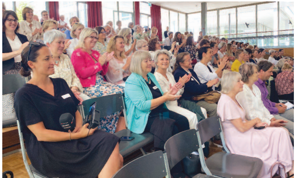
Une salle attentive lors de l'allocation de Simonetta Sommaruga dans l'aula du Gymnase Neufeld

(suite de la page 1) Grâce à la présence de Mary-Claude Bayard, Catherine Favre Alves et Catherine Frioud Auchlin, nos communes étaient parfaitement représentées lors de cette journée officielle qui s'est terminée sur une image forte: celle des 160 présidentes de villes et de communes réunies sur les marches du Gymnase