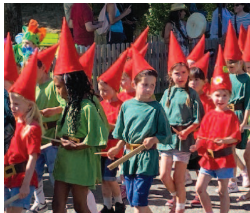
Jardiniers ou nains de jardin? Adorables en tout cas!

Du côté de la place de la Liberté, à l'exact opposé du ballet des insectes se déroulait une chorégraphie de toutes jeunes pousses. En effet, les plus petits portaient juste-au-corps vert, un vert éclatant qui était l'heureux reflet de la jeunesse, de la naissance, du bourgeon et