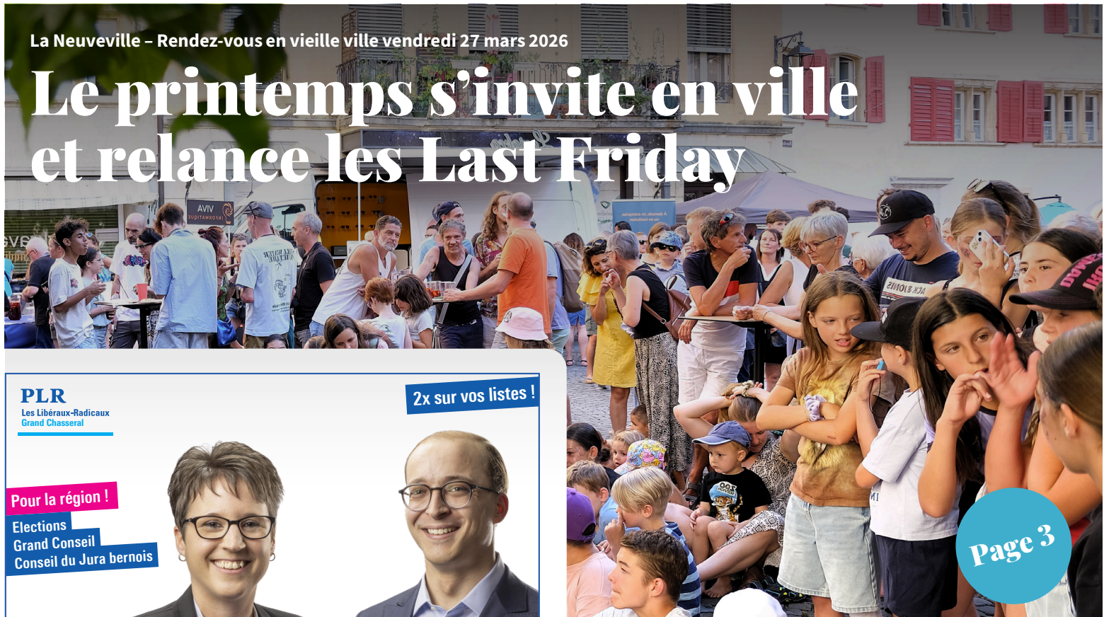
La Neuveville – Rendez-vous en vieille ville vendredi 27 mars 2026

Il y a des dimanches qui prennent une autre saveur quand la musique s'en mêle. Le 29 mars, au Landeron, la Chapelle des Dix-Mille-Martyrs s'apprête à vibrer au rythme d'un concert des Trouvailles Classiques qui s'annonce aussi fin qu'intense, porté par des musiciens d'exception et une formation peu commune. Page 17