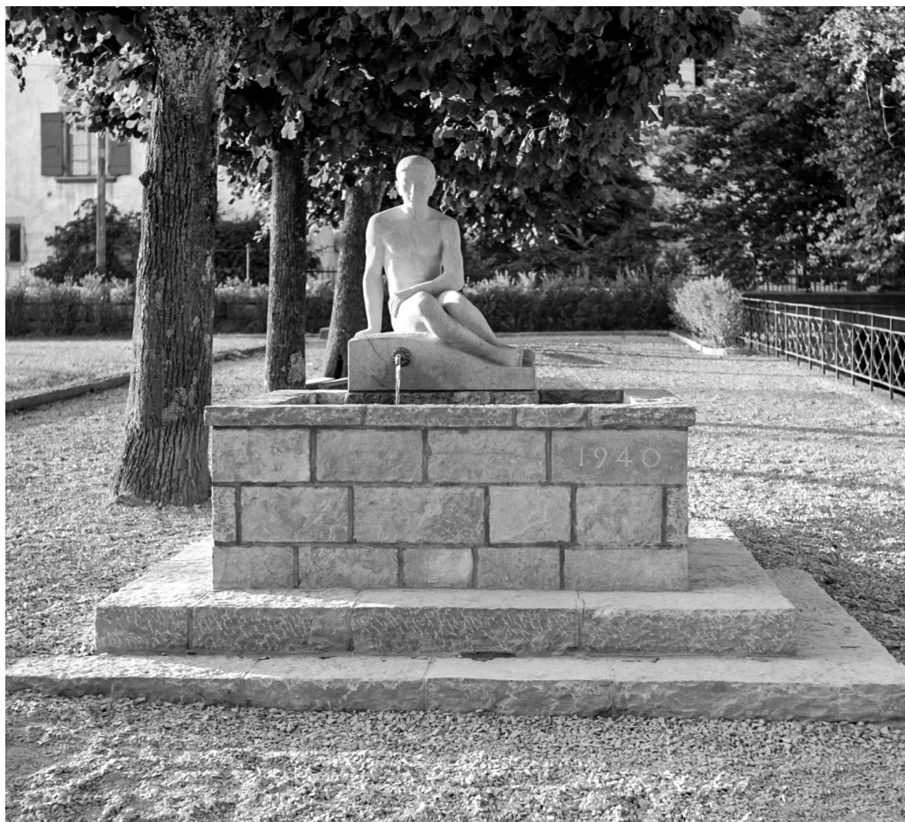
La Neuveville, 1942, Quai Maurice Moeckli - Fontaine de l'adolescent - Sculpture de Max Pfänder (collection Charles Ballif)