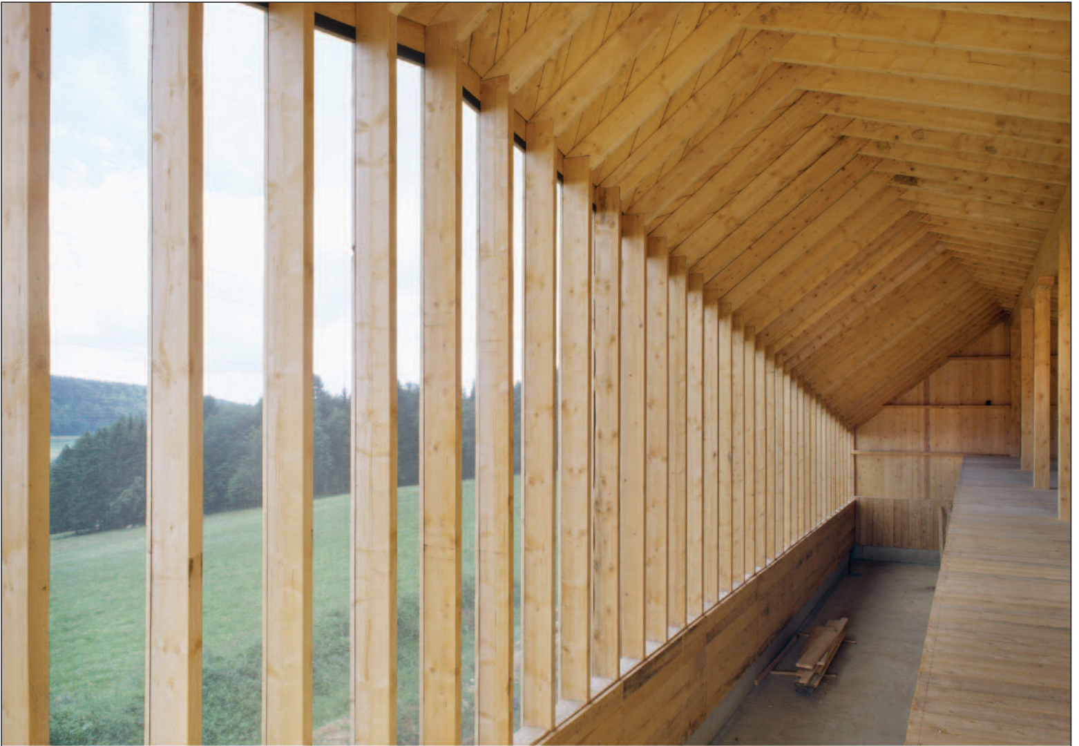
Bâtiment agricole, Lignères NE, 2005.