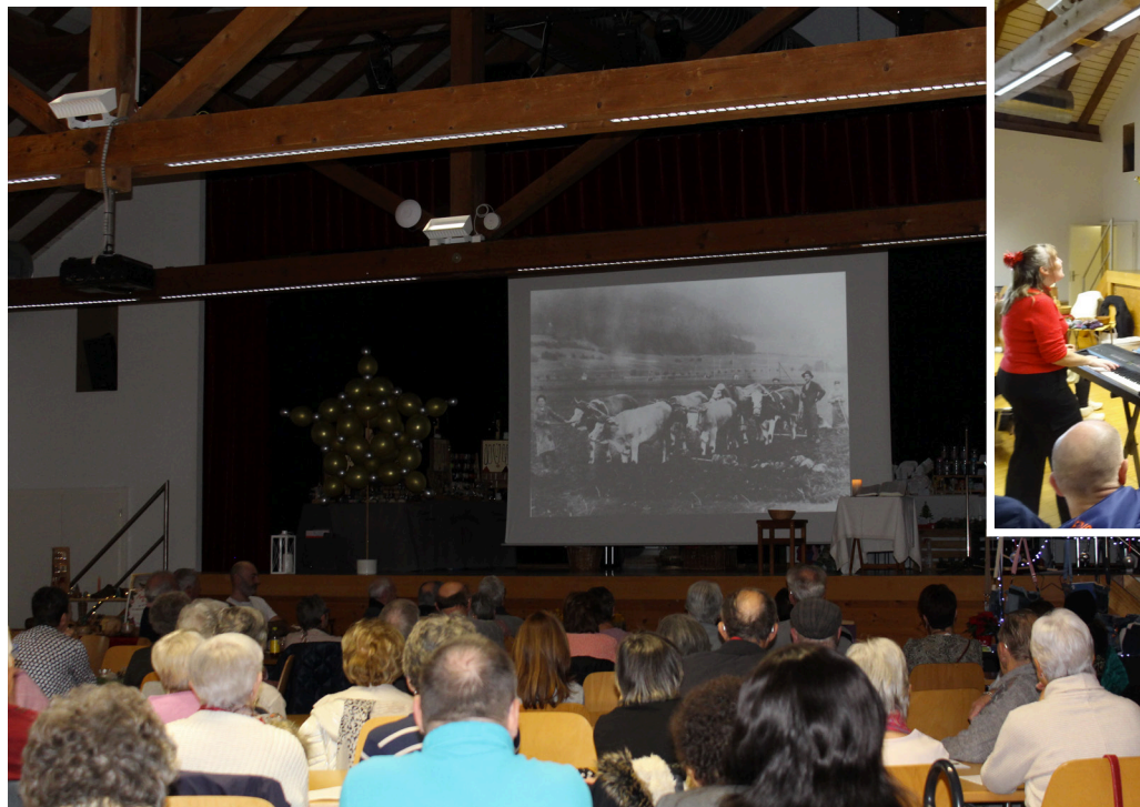
Un marché de Noël chaleureux qui a beaucoup plu au public.

Chaque fin d'automne, c'est lui qui ouvre la saison: le premier marché de Noël du Plateau. Et cette année encore, l'événement a donné le ton avec une énergie lumineuse. Entre culte, stands créatifs et chorale d'enfants, la 9 e édition, vécue le 23 novembre 2025, a offert une journée où l'on retrouvait tout ce qui fait battre le cœur de la région: une chaleur simple, une créativité débordante et un vrai sens du partage.