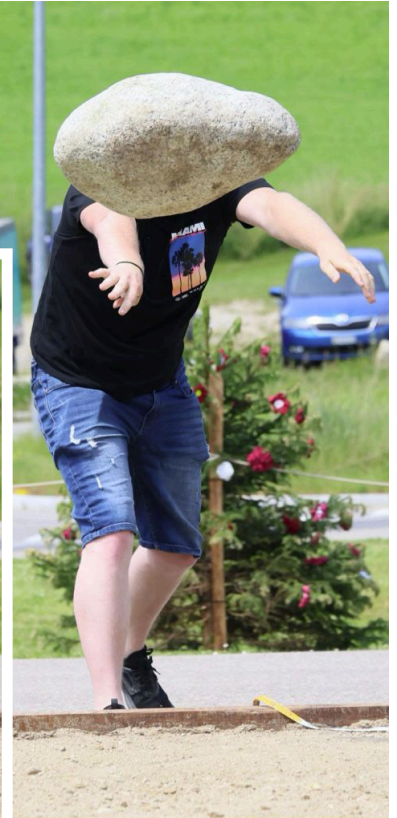
Même sans trucage, le lancer de la pierre par le président de l'Amicale est impressionnant !

Il y a des matins qui donnent une impulsion durable à tout un village. À Nods, l'Assemblée constitutive de l'Amicale de la pierre du Grand Chasseral s'est tenue hier matin au Battoir, marquant l'aboutissement d'une idée née sur le vif lors de la Fête de lutte de juin dernier. Un lancer improvisé, presque anodin, avait alors réveillé quelque chose : l'envie de rassembler autour d'un geste simple, authentiquement suisse, et profondément ancré dans l'identité du Grand Chasseral.