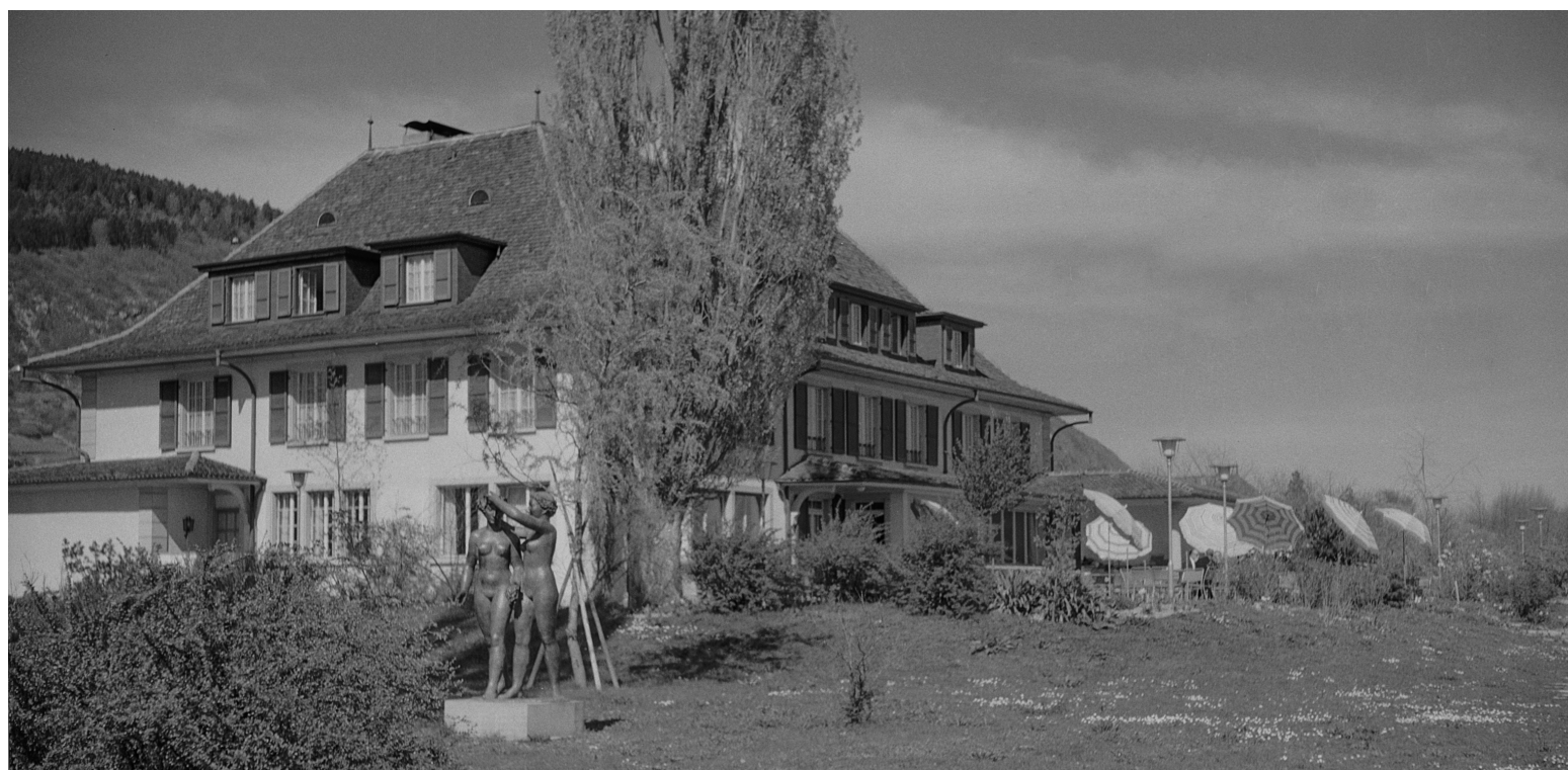
La Neuveville, 1954, Promenade J.-J. Rousseau - Hôtel J.-J. Rousseau (collection Charles Ballif)