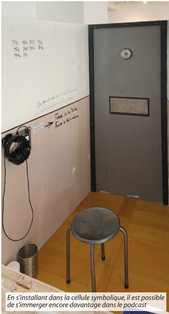
En s'installant dans la cellule symbolique, il est possible de s'immerger encore davantage dans le podcast

morceaux de musique partagés, le projet prend forme. "Il faut se concentrer sur le présent et l'avenir. Le passé... on ne peut plus le changer, mais on peut reconstruire."