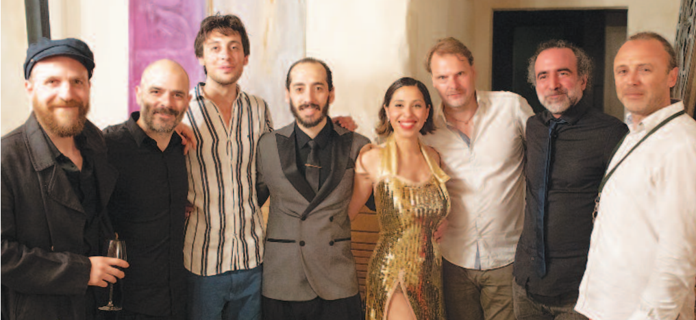
Les deux danseurs du Tango Show sont accompagnés par des musiciens de talent

La première demi-saison 2022-2023 de la Tour de Rive se poursuit samedi 1 er octobre avec un deuxième spectacle en collaboration avec le festival ArtDialog. Après avoir vibré au rythme de la pop italienne, de la Renaissance à nos jours, place cette fois au tango, une première pour la Tour de Rive, qui se réjouit de pouvoir accueillir une forme nouvelle sur sa scène.