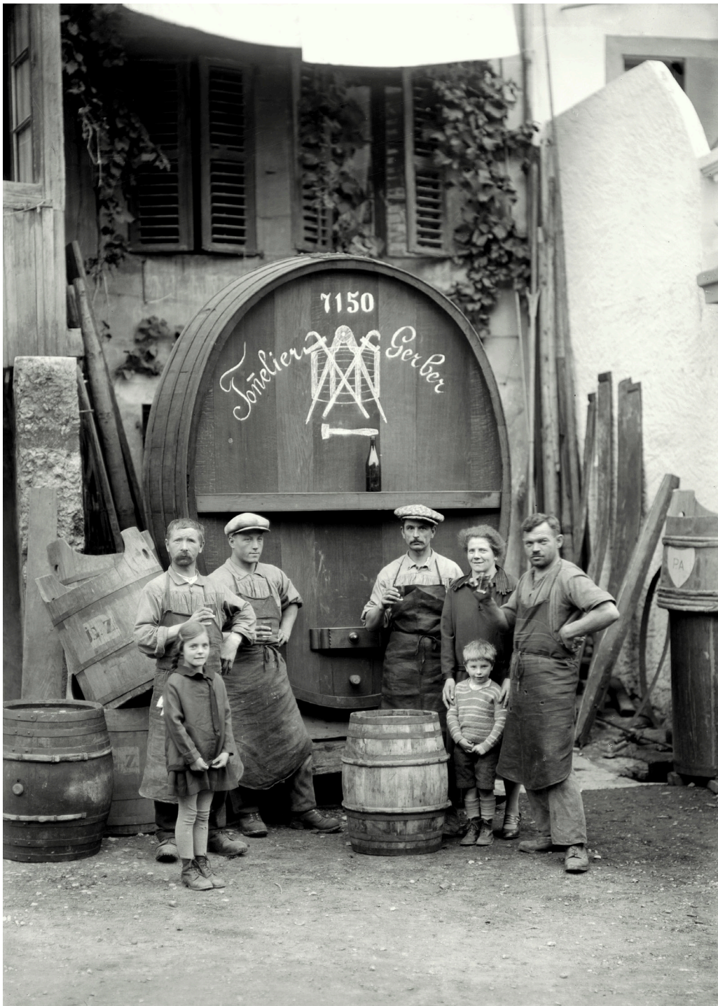
La Neuveville, 1927, Courtines Ouest - Tonnellerie Gerber