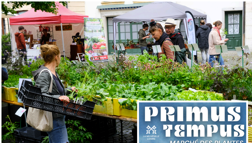
Primus Tempus, un rendez-vous devenu incontournable pour La Neuveville. (Mélanie Schleiffer)

De 10h à 16h, les ruelles se transformeront en un véritable jardin ouvert. Une trentaine d'exposants y déploieront leurs trésors: plantons soigneusement cultivés, cactus graphiques, ananas et produits dérivés, mais aussi toute une palette de spécialités artisanales. Miel, épices, tapenades, produits du terroir faits maison... autant de saveurs qui racontent une origine, une passion, un geste maîtrisé.