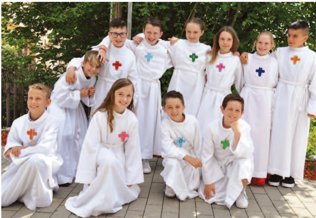
Le groupe des communié.e.s et leurs catéchistes