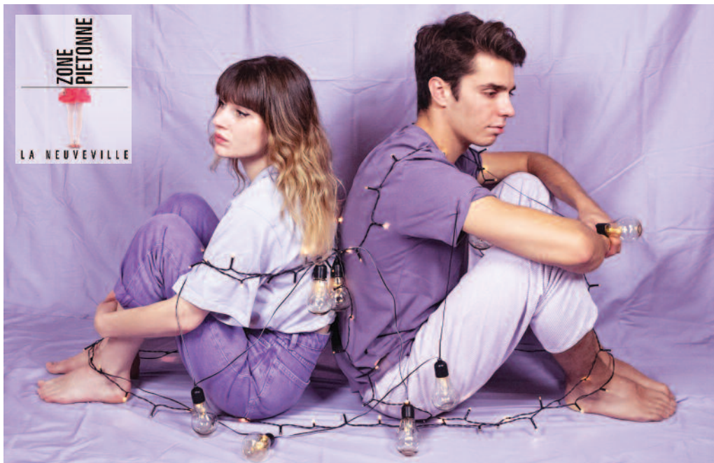
BARON.E sera en concert le samedi 18 juin.

Le nouveau programme de la Zone Piétonne séduira, à n'en pas douter, un public aussi riche que varié. Rendez-vous est donné sur la place de la Liberté dès le 21 mai avec une soirée au rythme des brises du Sud, qui donnera irrésistiblement envie de danser.