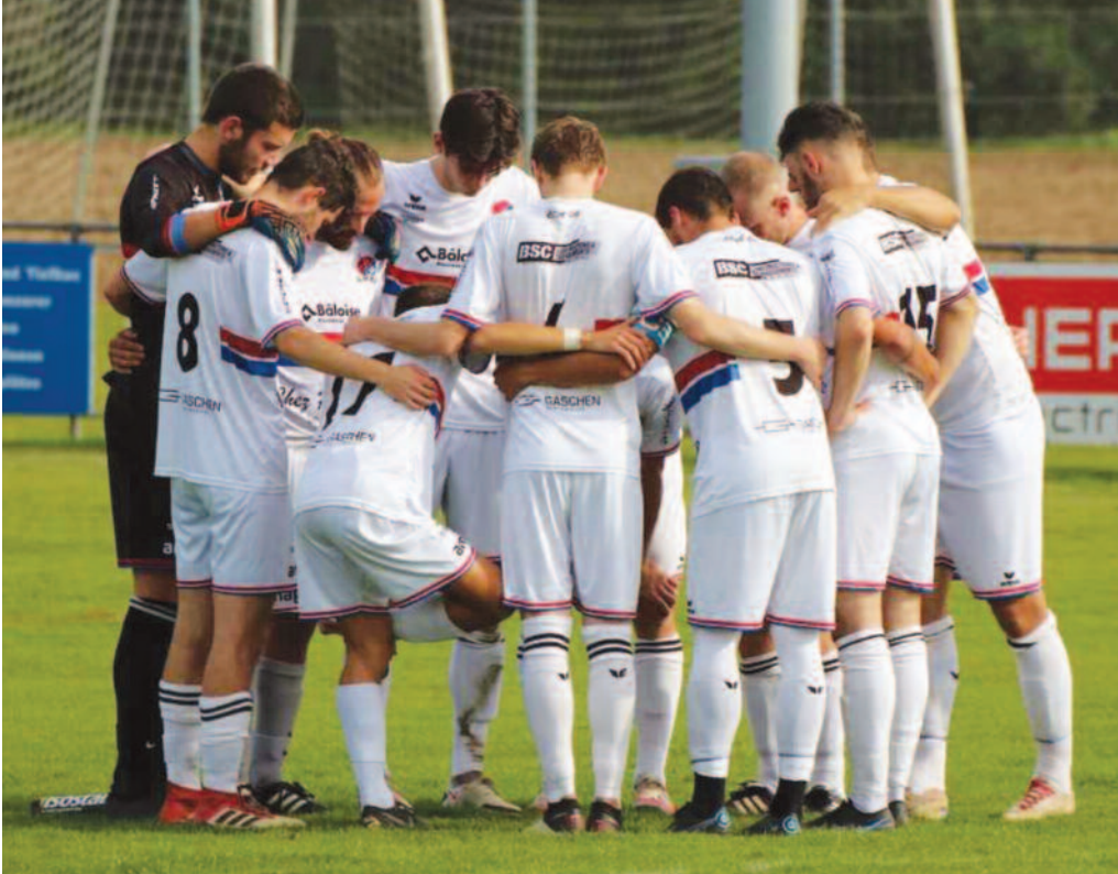
Concentration avant le match

C'était le dernier match de la saison au stade de La Neuveville. Le club local et leader du championnat a affronté son rival direct, la deuxième équipe du classement. L'équipe de la capitale bernoise, le FC Länggasse B, est sur les talons du FC LNL depuis le début de la saison.