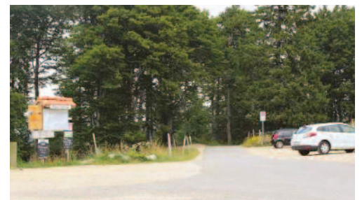
La Place Centrale, au-dessus des Prés-d'Orvin, est un lieu de départ de randonnée très fréquenté.

En plus de rappeler les règles de bonne conduite pour respecter la nature et le travail des agriculteurs, l'agricultrice veille par exemple à ce que les camping-cars ne stationnent pas la nuit à la Place centrale. A noter que le projet de stationnement payant aux Prés-d'Orvin et à