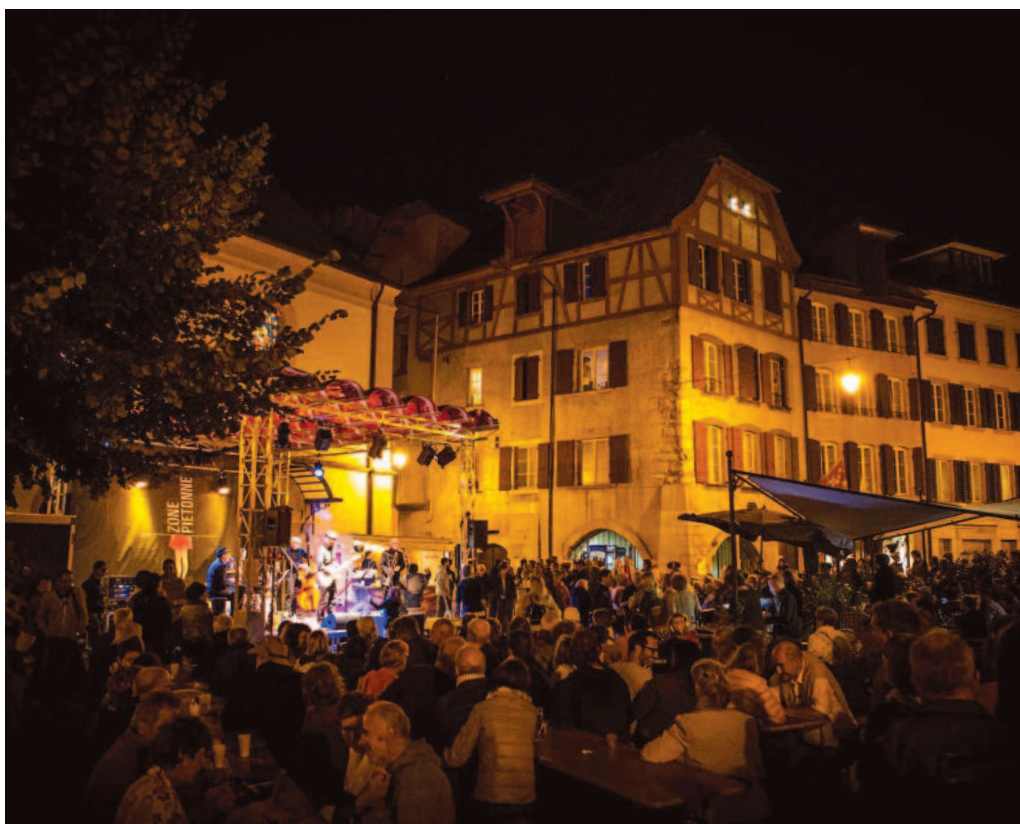
La place de la Liberté.

Les habitués de la Zone Piétonne peuvent se réjouir : ils retrouveront la place de la Liberté comme avant la pandémie, avec tables et bancs, et surtout offre de boissons et de restauration ! A noter que la scène sera légèrement décalée puisqu'elle est désormais plus grande et plus haute (elle sera placée juste devant le bâtiment de la commune), l'espace sera alors suffisant pour bouger et danser, dans un premier temps au rythme de la cumbia.