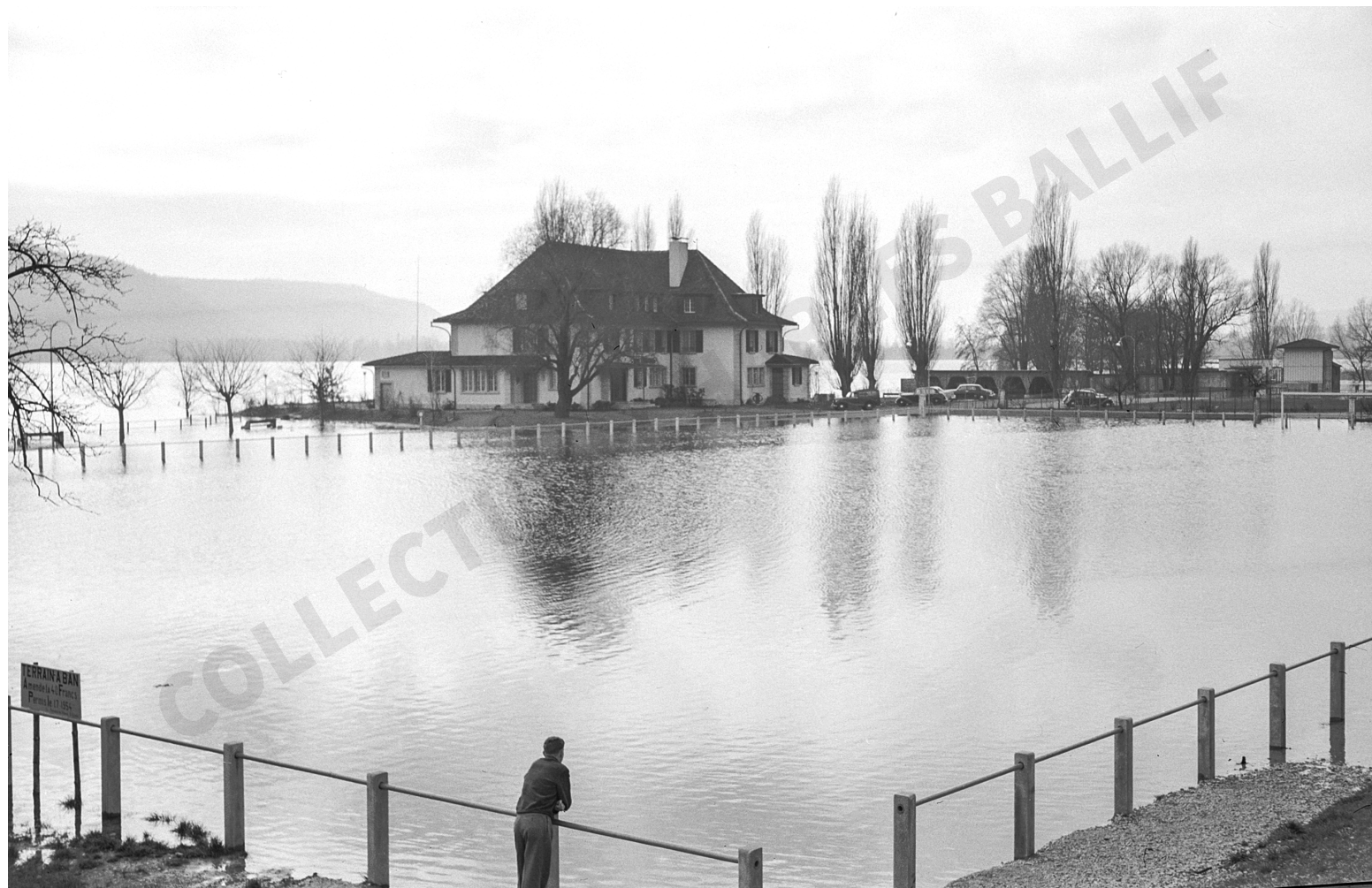
La Neuveville, 1955, Inondation - Hôtel J.-J. Rousseau