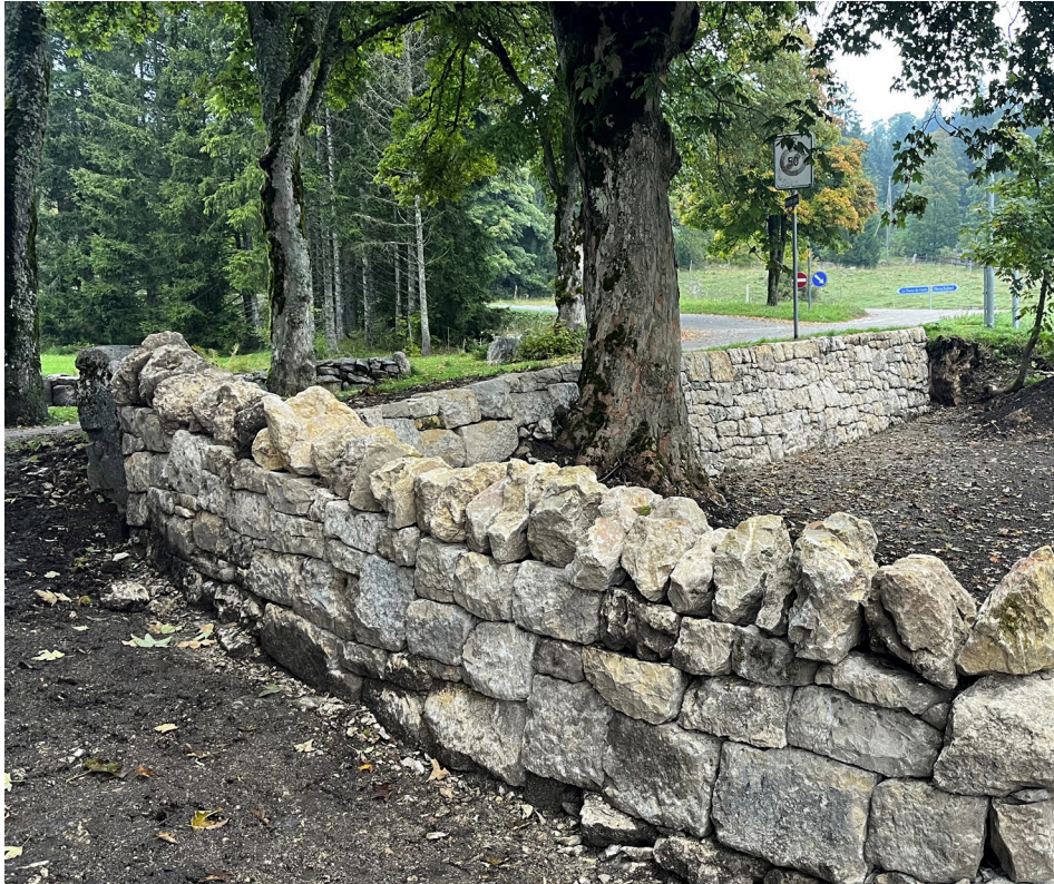
Restauration de murs de soutènement et à double parement effectuée dans le secteur de l'Aurore en 2025.