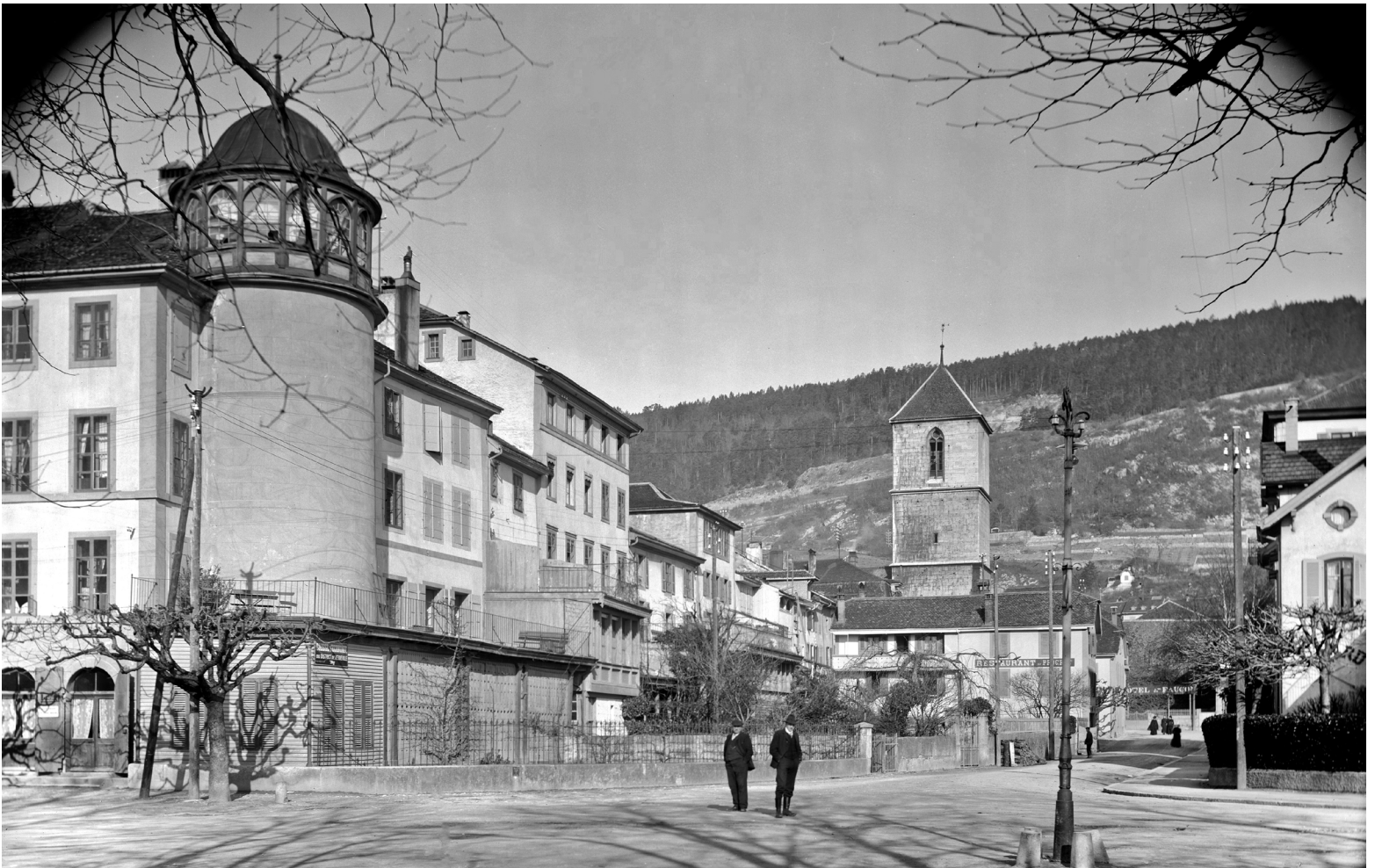
1934 La Neuveville - Rue de la Gare - Tour Wyss - Tour Carrée