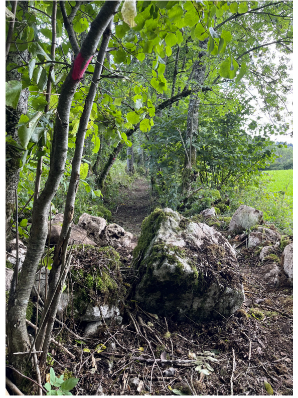
Ouverture d'un ancien chemin creux au Pâquier

En 2025, la Commune de Val-de-Ruz et le Parc régional Chasseral ont poursuivi leurs efforts en matière de mise en valeur du patrimoine et du paysage à travers le projet «Valorisation paysagère du Val-de-Ruz». Au programme: restauration d'une fontaine, ouverture d'anciens chemins creux et remise en état de murs en pierres sèches. Les diverses actions, démarrées en 2024 déjà, perdureront jusqu'en 2028.