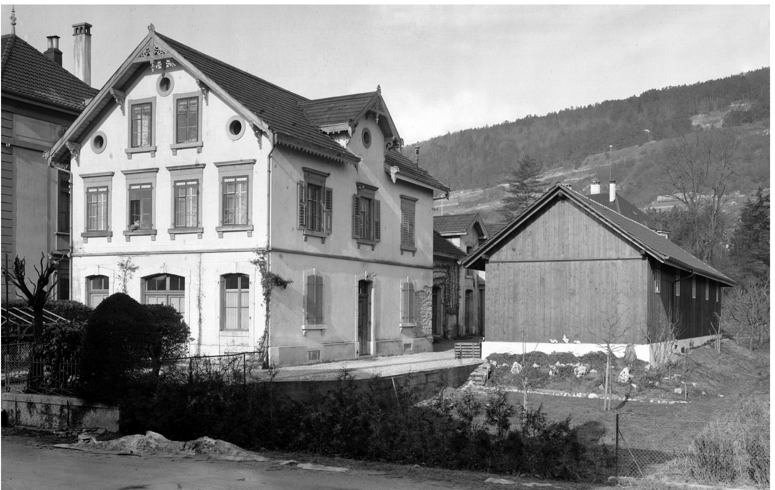
1935 La Neuveville - Place de la Gare - Maison Paul Stuki