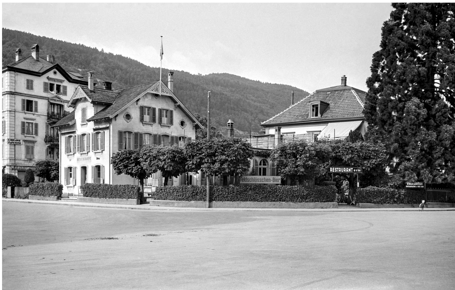
1939, La Neuveville, Place du Marché, Rue de la Gare, restaurant de la Gare