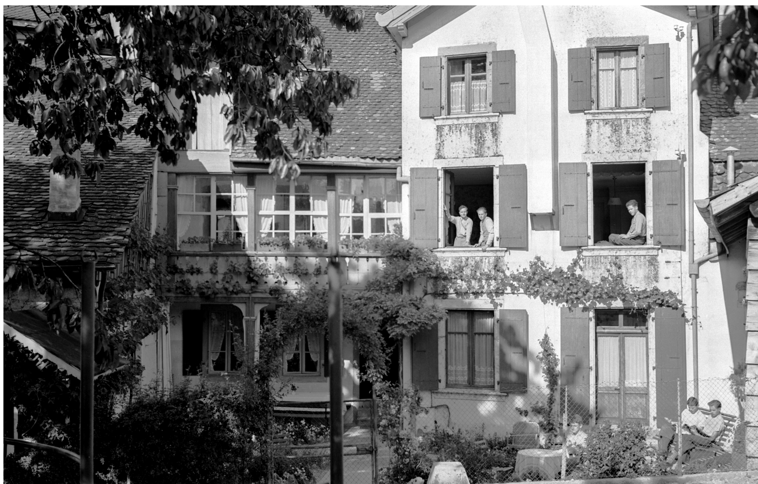
1939, La Neuveville, Rue des Mornets, pension Schenk