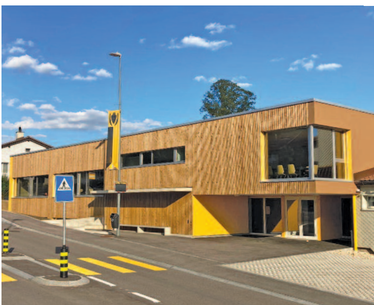
Il a fière allure, le nouveau collège de Nods !