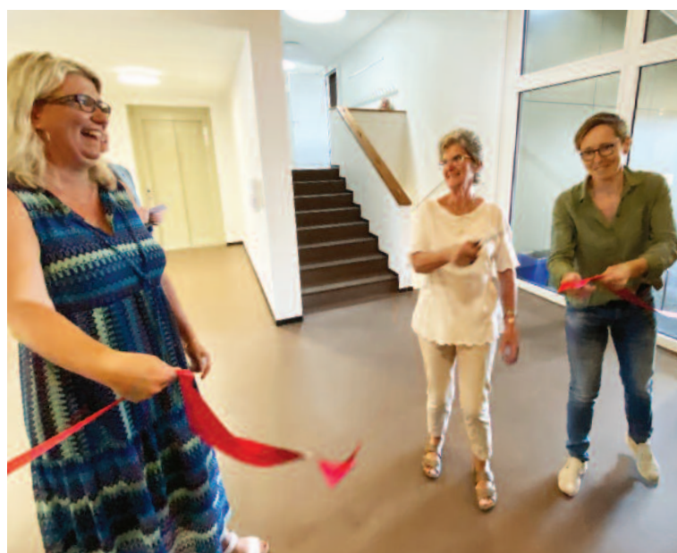
Bel éclat de rire en coupant le ruban qui inaugurerait officiellement le collège