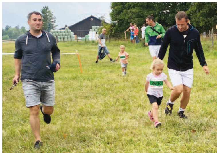
Les parents s'investissent et accompagnent leurs enfants