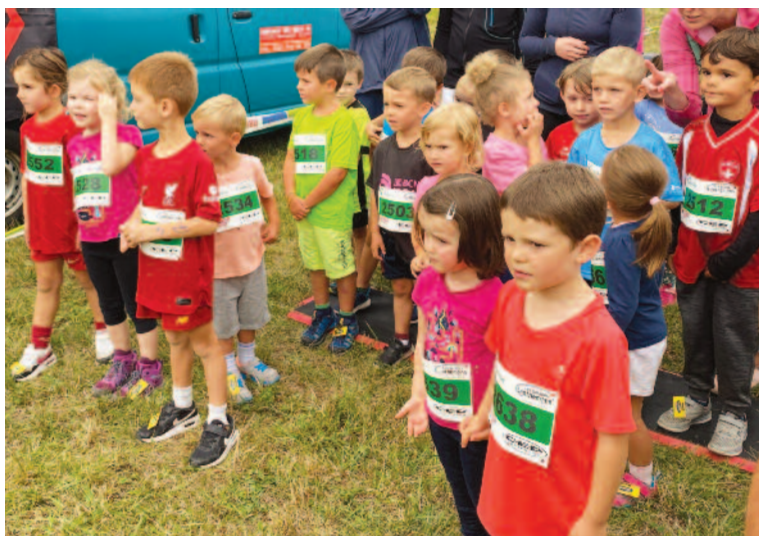
Les plus jeunes sont toujours les premiers à s'élaner lors de la Course de la Solidarité

Toutes et tous emporteront de cette course du 19 août à Prêles impressions et sensations. Des souvenirs qui se créent au fil de la course, des échanges, des efforts consentis, ensemble. Cette année, l'argent récolté ira à un projet humanitaire de l'EPER pour soutenir l'agriculture durable au Cambodge. Entre le Plateau de Diesse et ailleurs, des liens se tissent ainsi, des liens empreints d'humanité. Céline