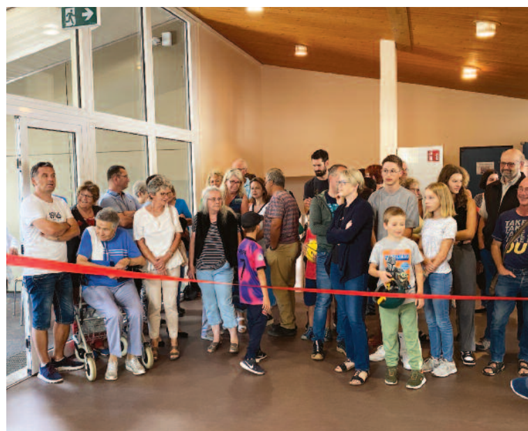
De nombreuses personnes intéressées ont participé à cet après-midi portes ouvertes