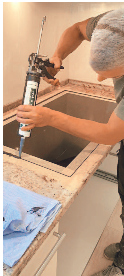
Le goût du travail soigné

"Au début, il faut faire sa place et s'intégrer dans le paysage professionnel de la région", sourit-il. Et si les grands chantiers ne lui font pas peur, c'est plutôt dans des réalisations plus