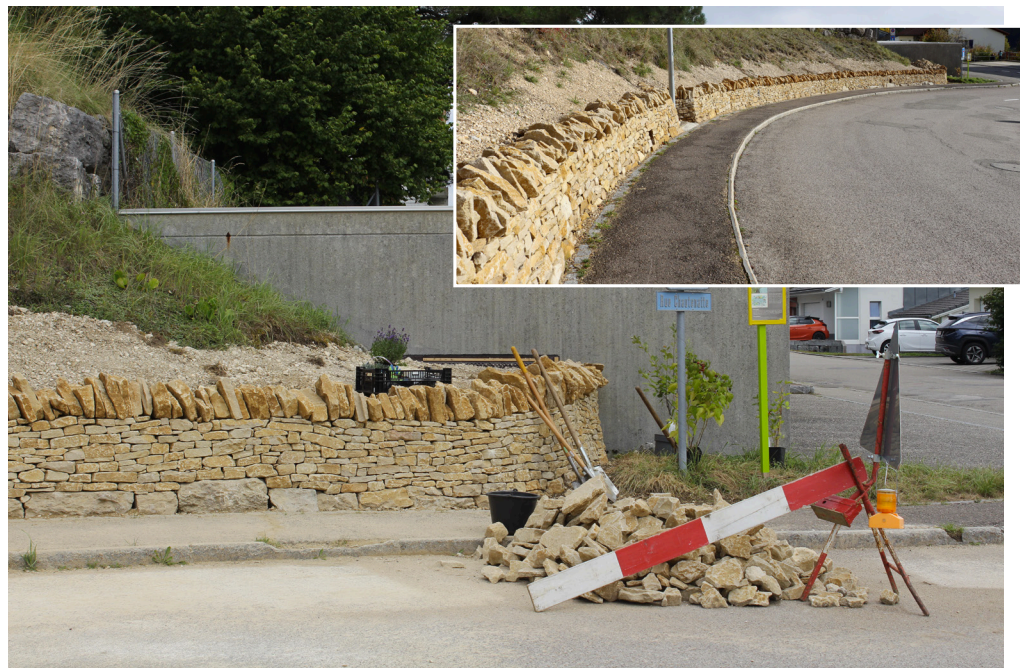
Un nouveau mur en pierres sèches long de 74 mètres embellit la rue Chautenatte depuis l'été 2025. En bas à droite: la carte des actions et aménagements réalisés en 2025 à Tramelan (photo et carte: © Parc Chasseral).

La Commune de Tramelan et le Parc régional Chasseral ont poursuivi en 2025 leur engagement pour des traverses urbaines alliant mobilité douce, biodiversité et amélioration du cadre de vie. Entre plantations, aménagements paysagers et événements fédérateurs, le village s'est entre autres enrichi d'un nouveau mur en pierres sèches. D'autres actions seront menées l'an prochain et jusqu'en 2028.