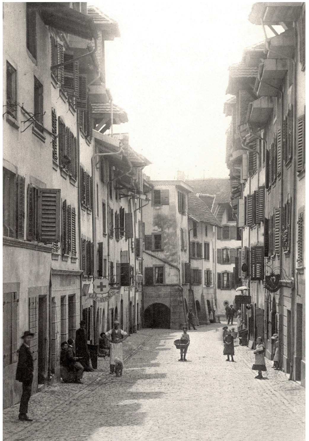
La Neuveville, ~1880, Rue Beauregard