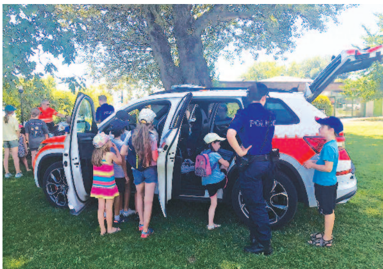
L'activité Immersion au sein de la police a fait grande impression aux participants

N'hésitez pas à nous contacter à passvacances2520@gmail.com