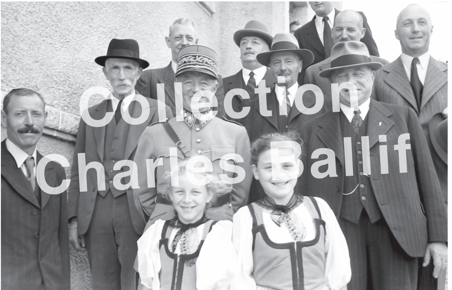
Prêles 1945, foyer d'éducation visite du général Guisan.