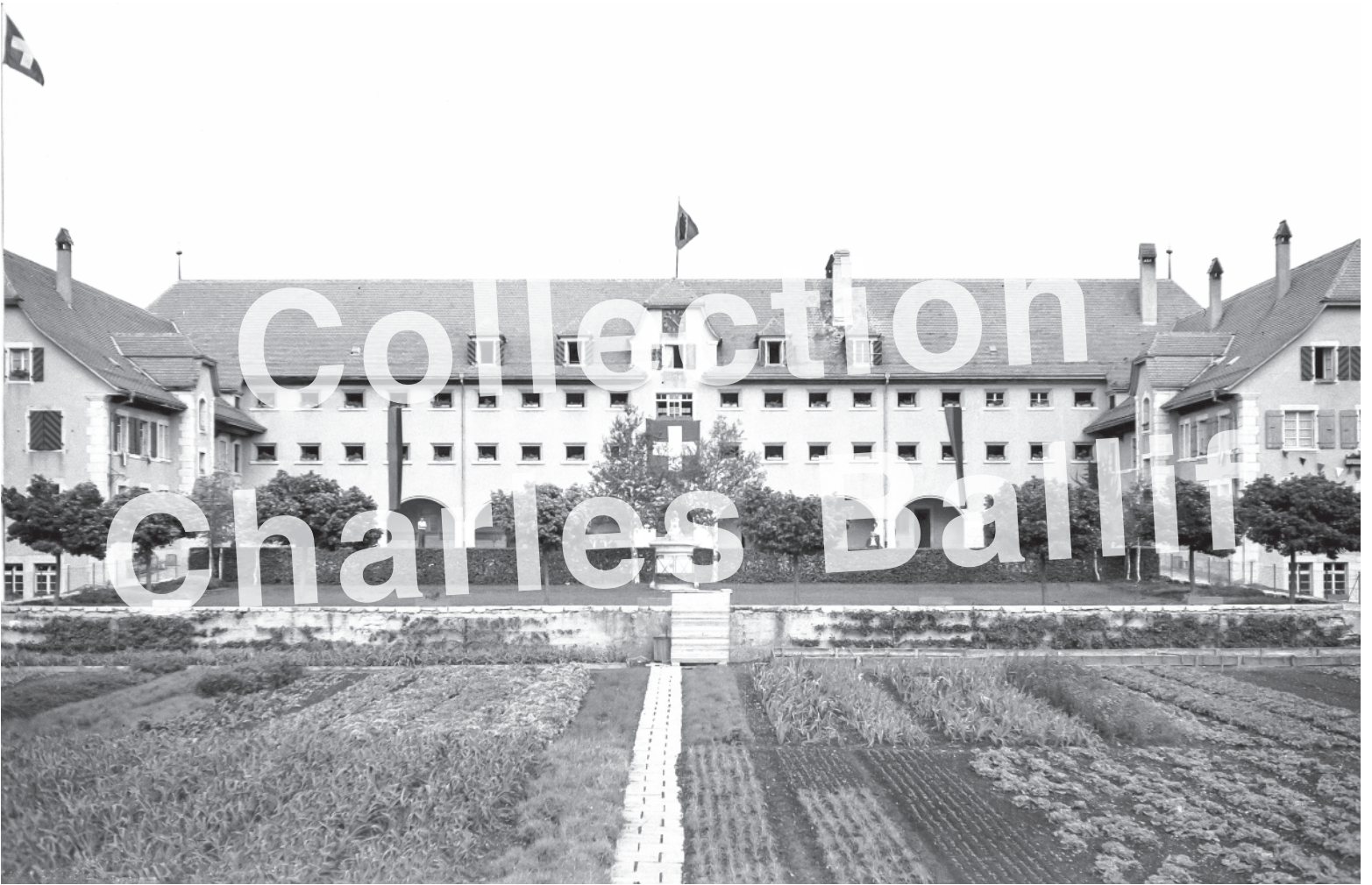
Prêles 1945, foyer d'éducation.