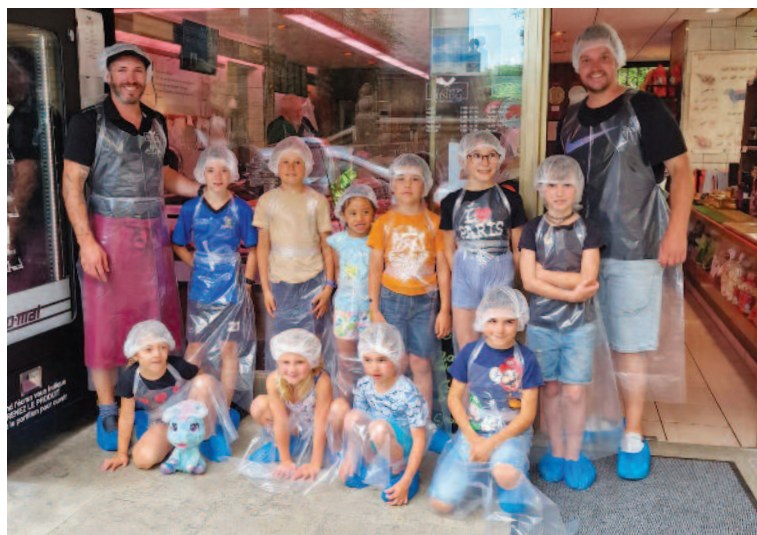
Les bouchers en herbe ont apprécié la fabrication de saucisses à la boucherie Junod