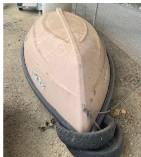
La Municipalité de La Neuveville.