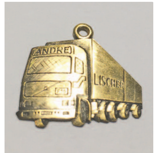
Parfois, les commandes sont... surprenantes !