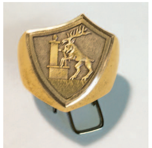
Tout l'amour du détail en une gravure