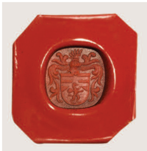
La chevalière peut servir à cacher une lettre