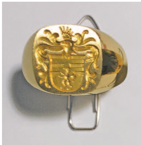
Les chevalières, l'une des spécialités du graveur