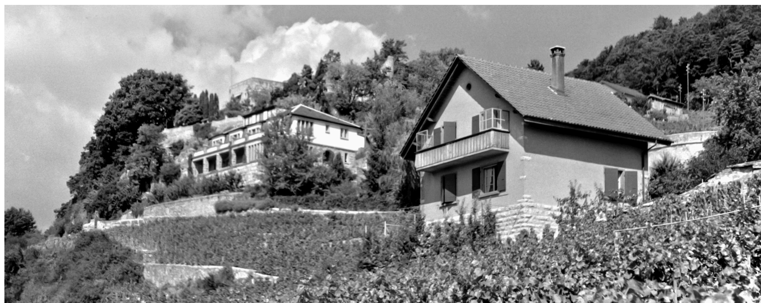
La Neuveville, ~1940, Route du Château - Maison Honsberger - Chante-Merle (Famille Tripet-Lée) - (collection Charles Ballif)

Conseil du Syndicat de gestion forestière Mont Sujet