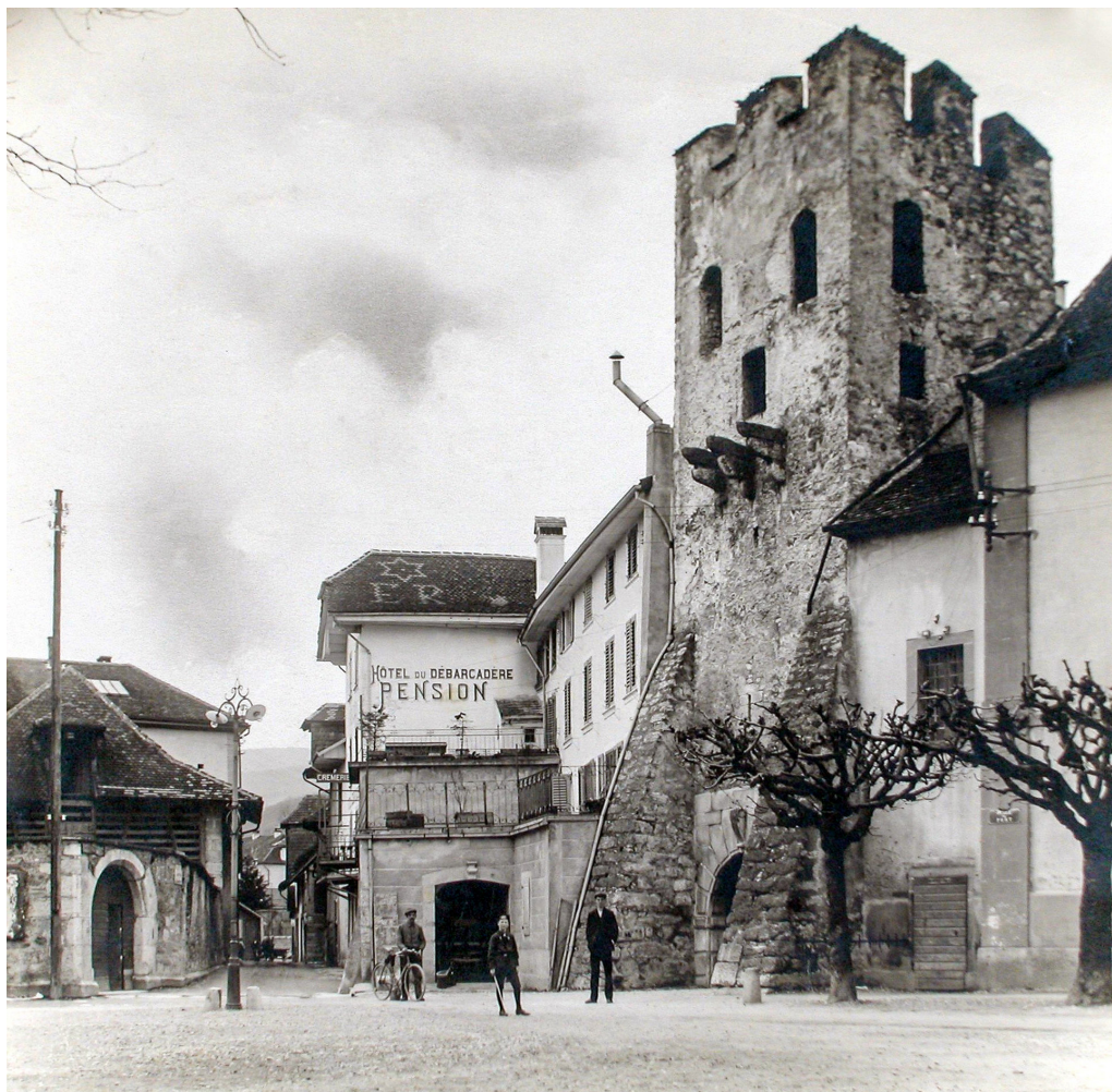
La Neuveville, ~1900, Place du Marché - Rue du Port - Tour de Rive