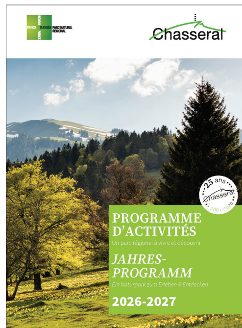
La couverture du Programme d'activités 2026-2027 du Parc Chasseral, très printanière, invite à la découverte multisensorielle de notre région.

S'engager auprès du Parc. Chacune et chacun peut s'investir au profit d'un développement durable de notre région. Différentes actions de terrain sont proposées par le Parc, du chantier nature pour les groupes aux astuces bien pensées pour préserver la biodiversité dans son jardin ou sur son balcon. Pour les écoles, de multiples animations et projets scolaires sont proposés aux enseignant-es afin de faci-