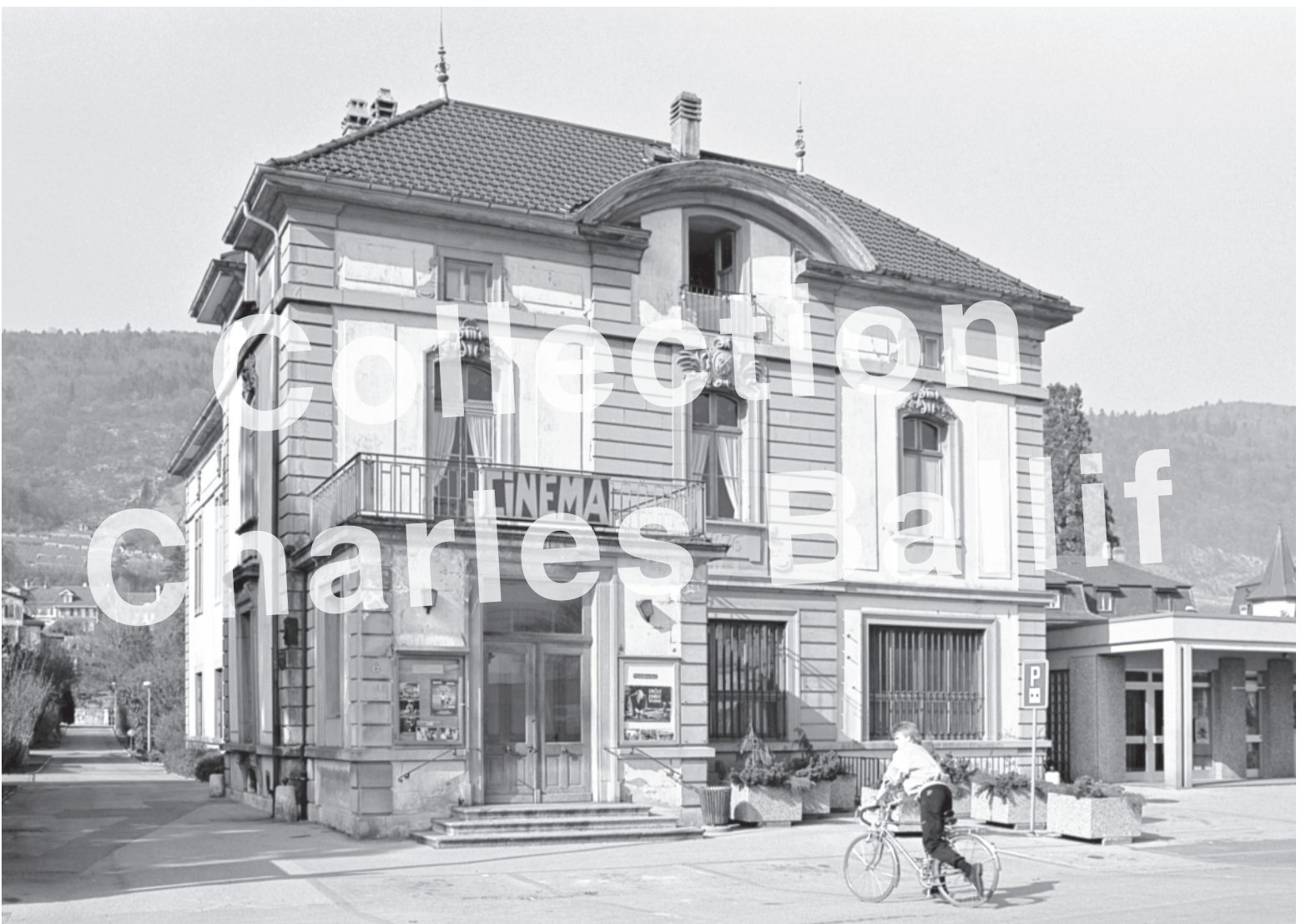
1988, le cinéma (Centre des Epancheurs)

Le programme complet des Journées européennes du patrimoine figure sur www.nike-kulturerbe.ch/fr/actuel