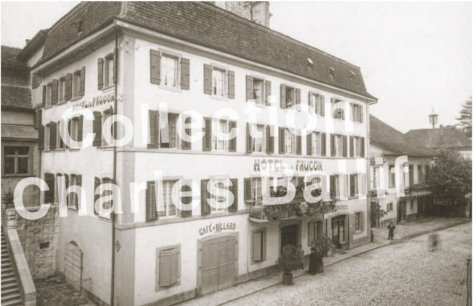
1910 l'Hôtel du Faucon.