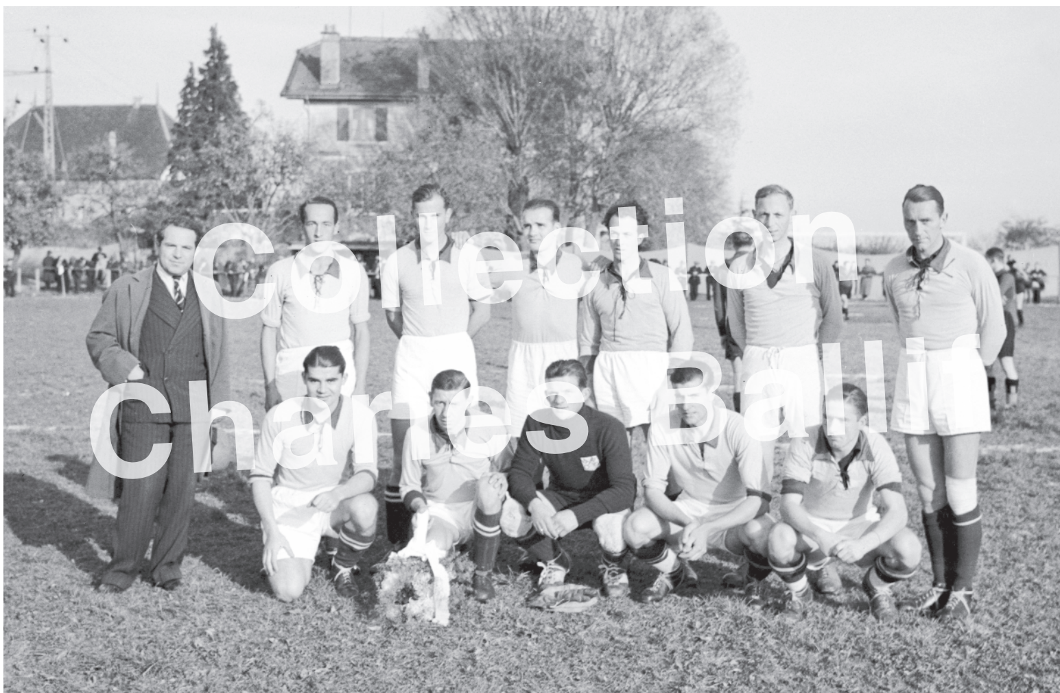
La Neuveville 1935, Football Club.