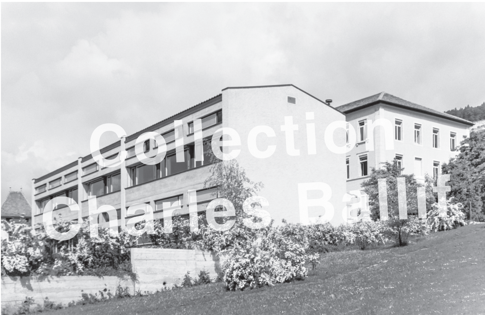
La Neuveville 1962, Nouveau pavillon de l'école primaire.