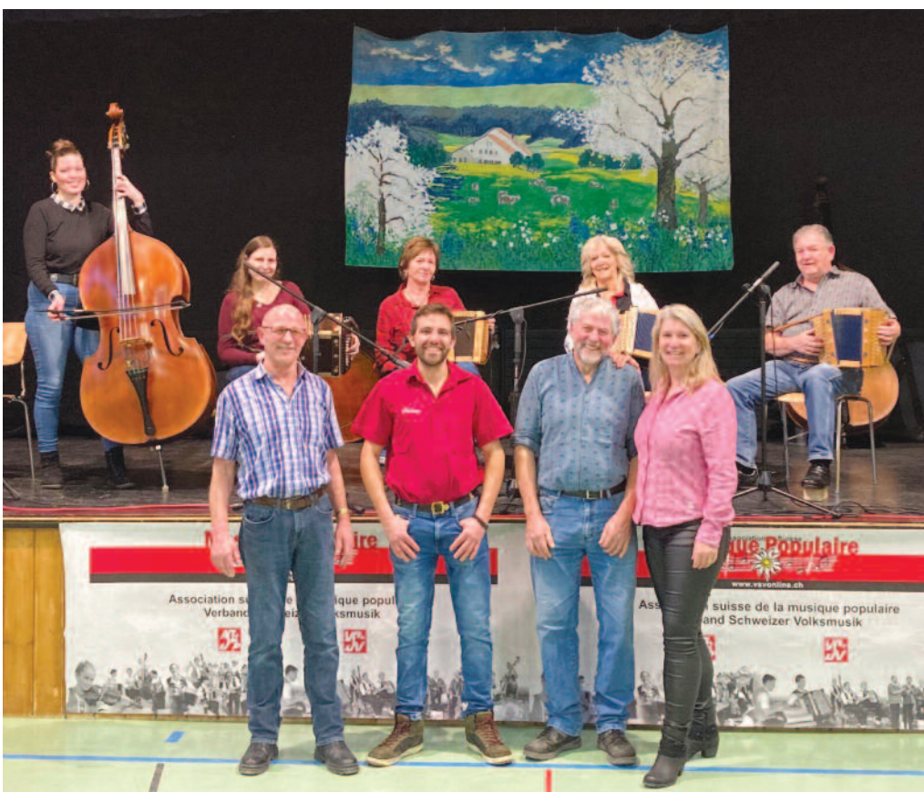
Le quatuor Örgelifründe Aegelsee, lors du concert apéritif.

Pour la 28 e édition de la Stubete à Nods, les organisateurs ont, une nouvelle fois, assuré en proposant une journée riche en prestations dans une halle de gymnastique pleine comme un œuf.