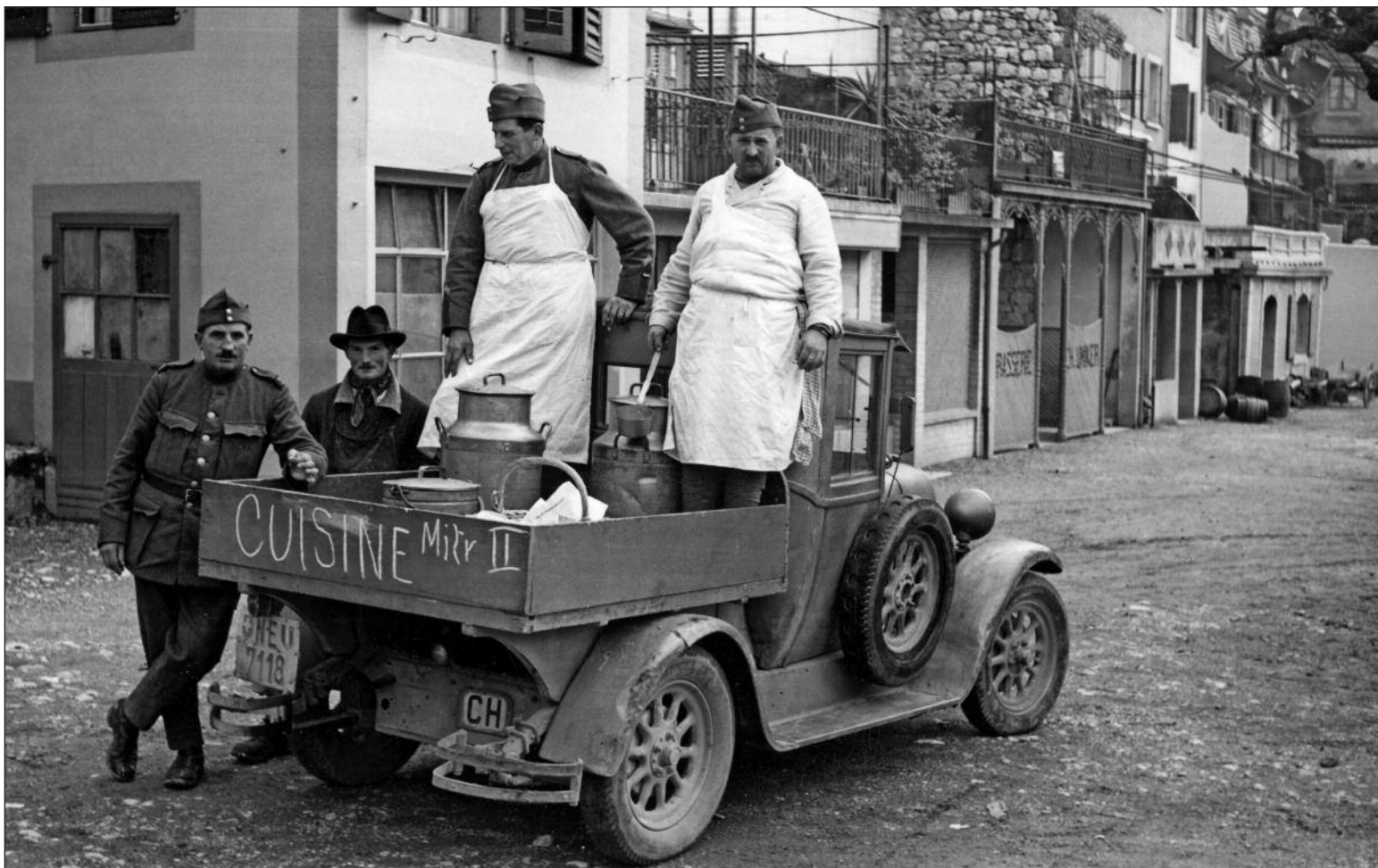
La Neuveville 1939 - Courtines ouest, cuisine militaire.