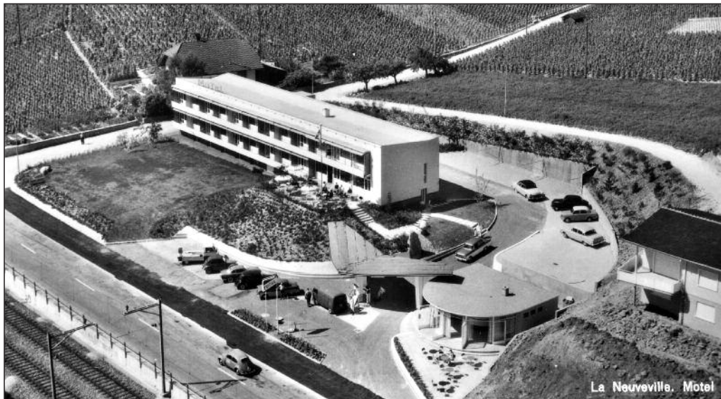
Le Motel, carte postale env. 1960.

Vous souvenez-vous du Motel ? La station d'essence ? Les délicieuses pizzas "Chez Vincent" ? Aujourd'hui rénové et transformé, il est devenu le Moitel et abrite les activités de l'atelier oi, connu dans le monde entier pour sa créativité et la qualité de son travail.