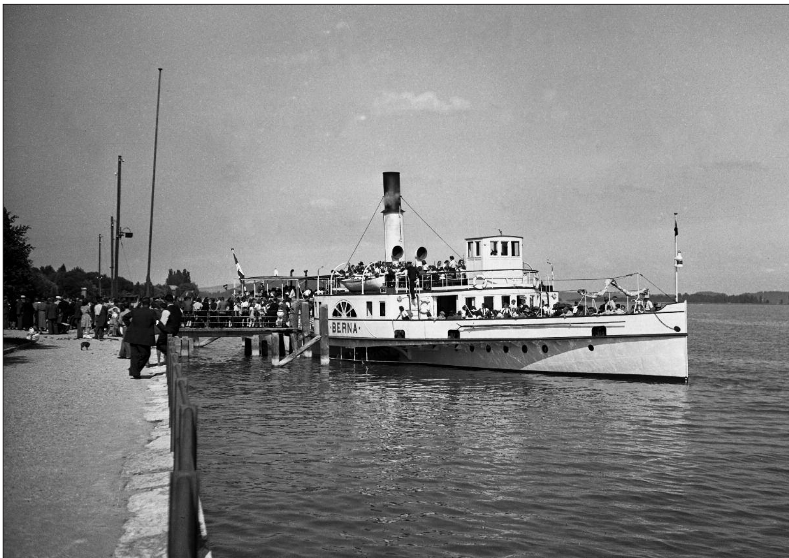
La Neuveville 1945 - Le bateau Berna au port.