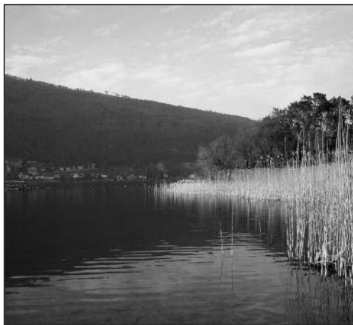
Bords du lac de Bienne

La nature doit reprendre ses droits dans les cours d'eau et les lacs du canton de Berne. Les planifications nécessaires s'agissant de l'espace réservé aux eaux, des mesures de revitalisation des eaux et d'assainissement des centrales hydrauliques ont été définies dans le concept cantonal d'aménagement des eaux. Ces planifications seront mises en œuvre progressivement au fil des prochaines années.