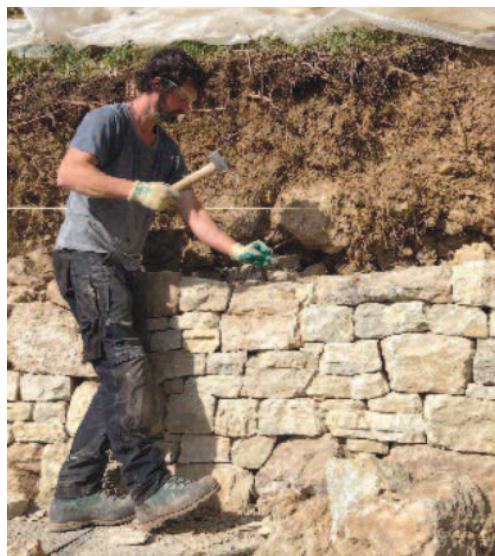
Rénovation d'un mur entre deux parcelles de vigne à La Neuveville au lieu-dit "Les Blanchardes"

Trois chantiers de rénovation de murs en pierres sèches ont débuté au mois de mars au cœur du magnifique vignoble du lac de Biemme, à La Neuveville et à Douanne-Daucher. Ces projets résultent d'une nouvelle collaboration entre le Parc Chasseral, les communes vigneronnes du lac de Biemme, la fédération des vignerons et Patrimoine bernois. Au total, plus de 140 mètres linéaires de murs, représentant une surface de 240 m 2 , seront rénovés entre 2023 et 2024.