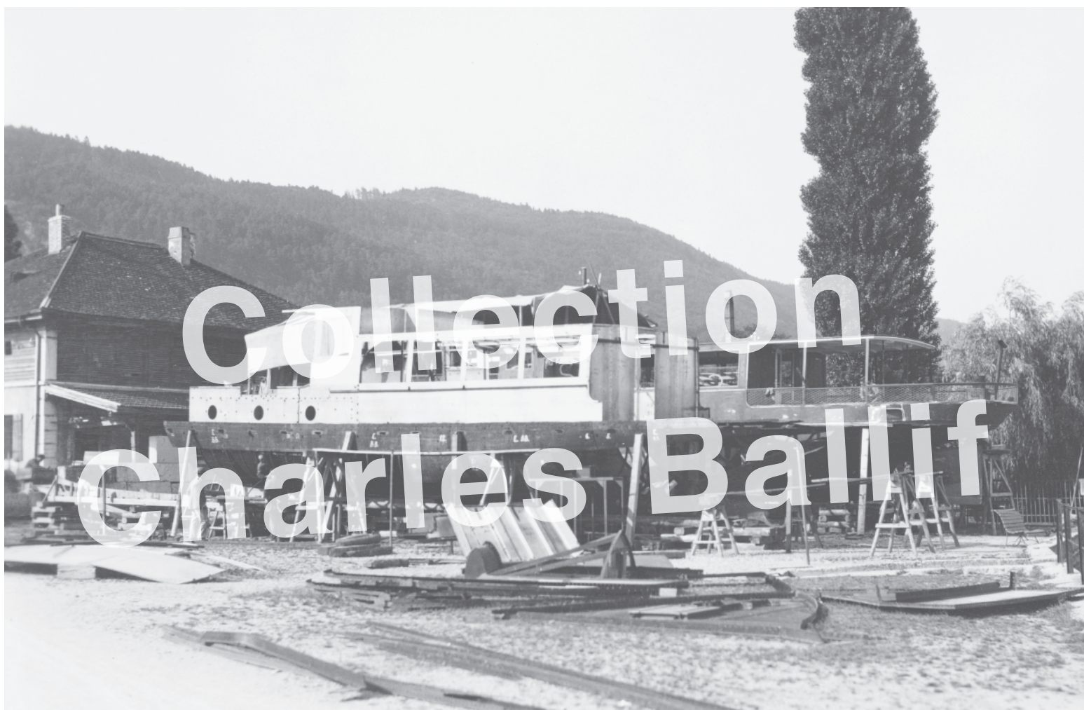
La Neuveville 1932, construction des bateaux Seeland et Jura devant le Lessivier.