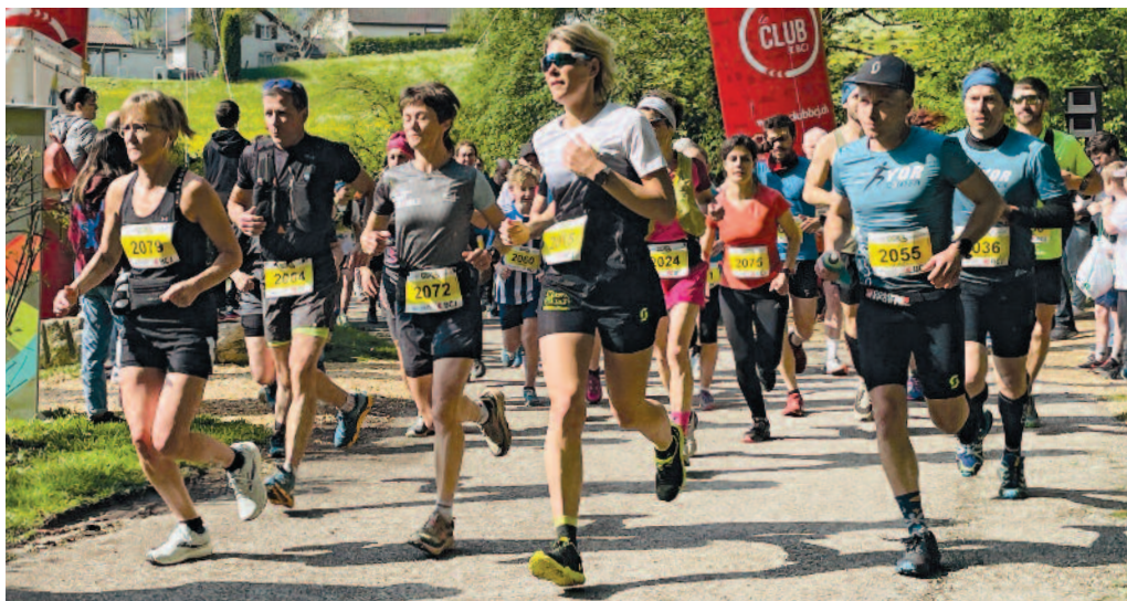
Sport populaire par excellence, la course à pied sera à l'honneur le samedi 6 mai à Moutier dans le cadre de la PoP'uP run, course pédestre populaire unique en son genre destinée aux adultes et aux enfants. (photos ldd)

Destinée aux adultes et aux enfants, la PoP'uP run est une course pédestre populaire unique en son genre. La 6 e édition se déroulera le samedi 6 mai (de 8 h à 18 h) aux abords de l'ancien stand de tir, à Moutier. Les organisateurs attendent près de 350 coureurs et un nombreux public pour les encourager.