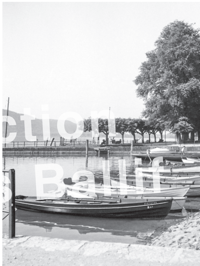
La Neuveville 1945, le petit port.