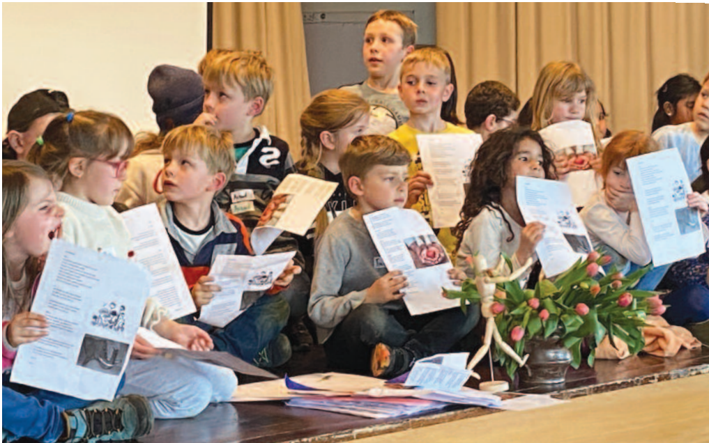
Les enfants s'en sont donné à cœur joie devant leurs parents vendredi en fin d'après-midi.

Organisées par la paroisse réformée de La Neuveville, les trois journées de la première semaine de vacances, juste après Pâques ont rencontré un vif succès. A tel point que les organisateurs ont dû refuser du monde.