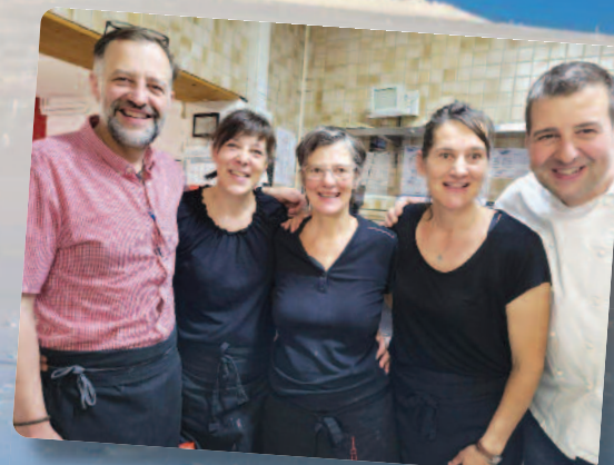
Être 6 frères et sœurs, quel bonheur! (un membre manque)