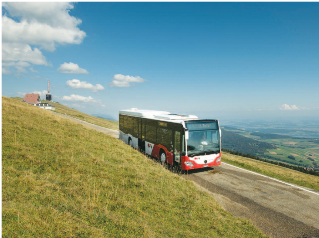
A la belle saison, plusieurs bus mènent au massif du Chasseral.

Avec le retour des beaux jours, le sommet du Chasseral est à nouveau la cible privilégiée d'excursions. Les offres de transports publics s'adaptent. La ligne Nods-Chasseral, exploitée par CarPostal, reprendra du service le samedi 29 avril.