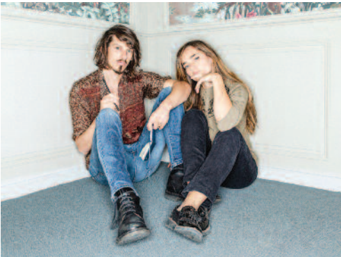
Aliose.

En quelques années le duo suisse Aliose a su trouver une place bien personnelle dans le paysage de la chanson pop francophone après de nombreux concerts en Suisse et à l'étranger.