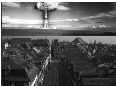
La Neuveville est située en zone 2 de la centrale atomique (photo-montage de Jan Boesch)