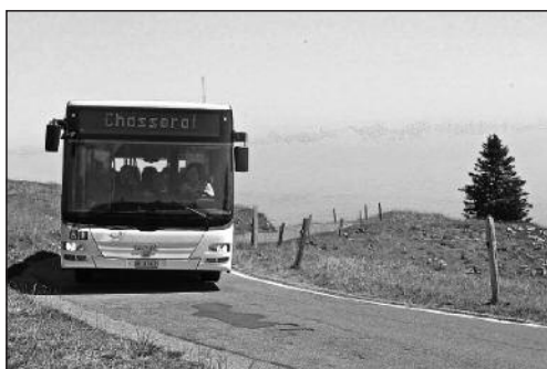
Car Postal sur la route de Chasseral.