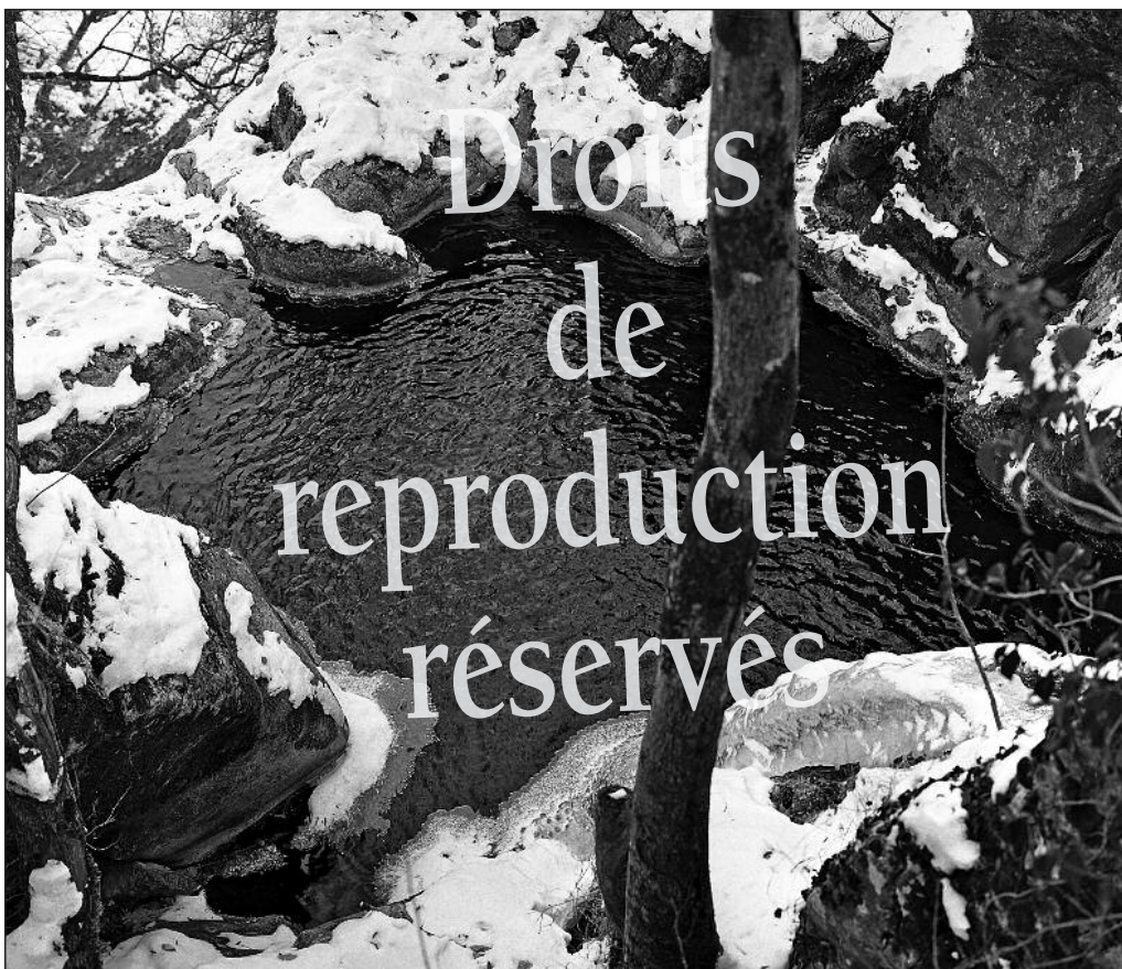
Le lac des Fées en 1962.