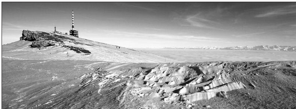
Le sommet de Chasseral

Après trois ans d'attente des sportifs régionaux de l'Arc Jurassien, une course de skis de randonnée et de raquettes à neige sera organisée au Chasseral.