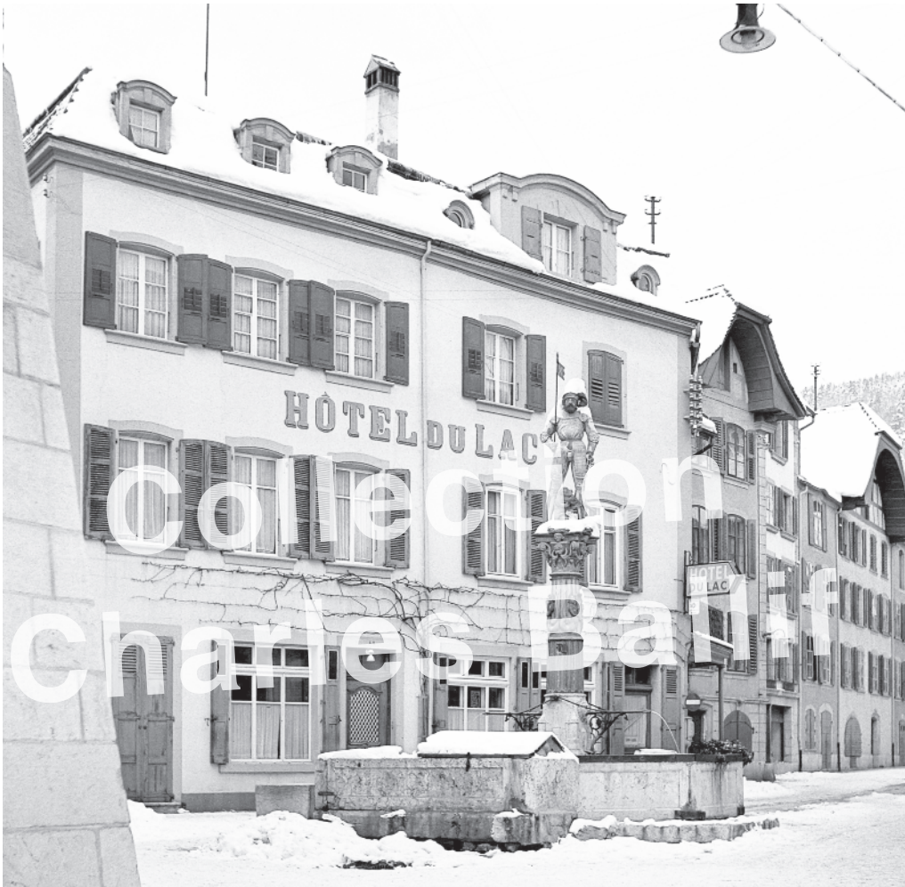
Hiver 1944, La Neuveville, place de la Liberté

L'équipe de la Ludothèque vous souhaite un très bel été et d'excellentes vacances !