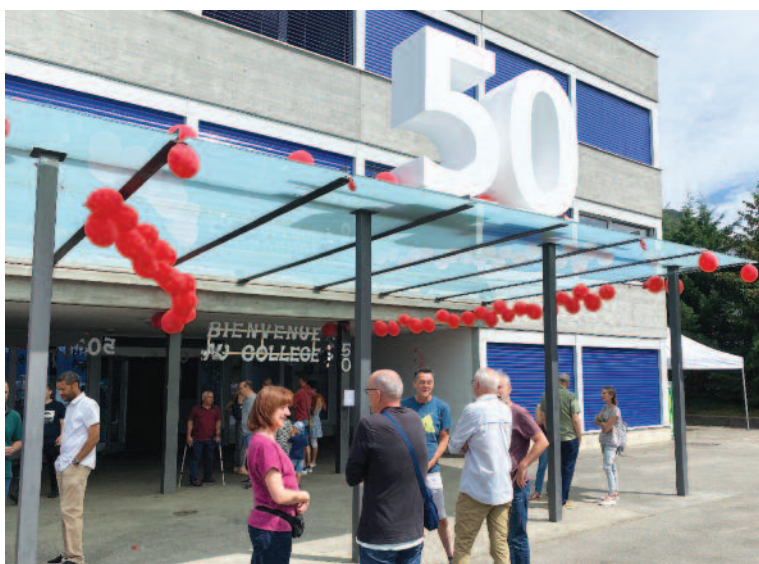
Le 50 e anniversaire du Collège du District de La Neuveville, ça se fête !