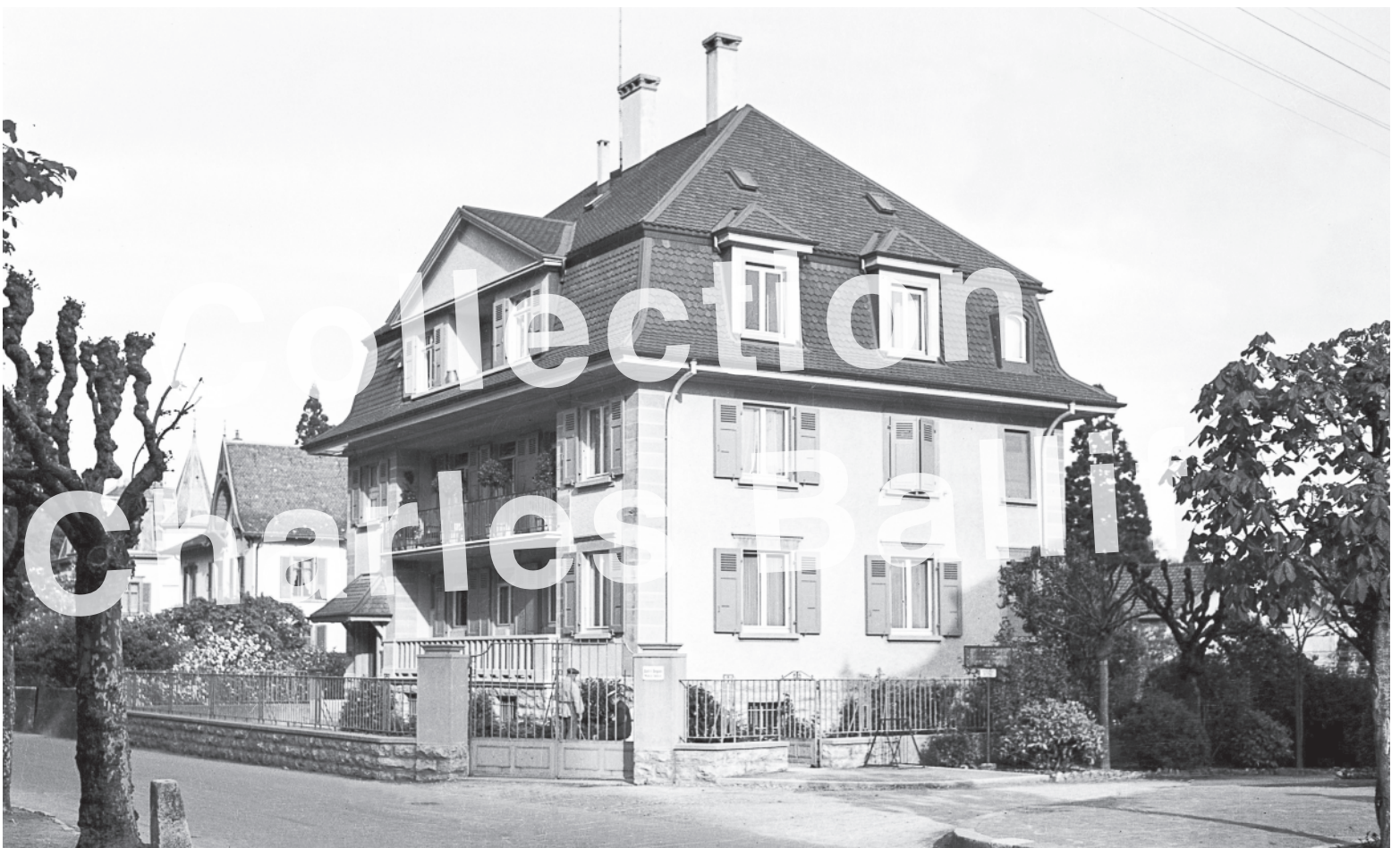
1940 La Neuveville, Avenue des Collonges la maison Hurni.