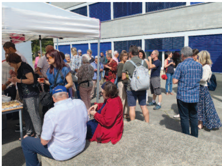
Il y avait foule toute la journée dans et aux abords du collège.