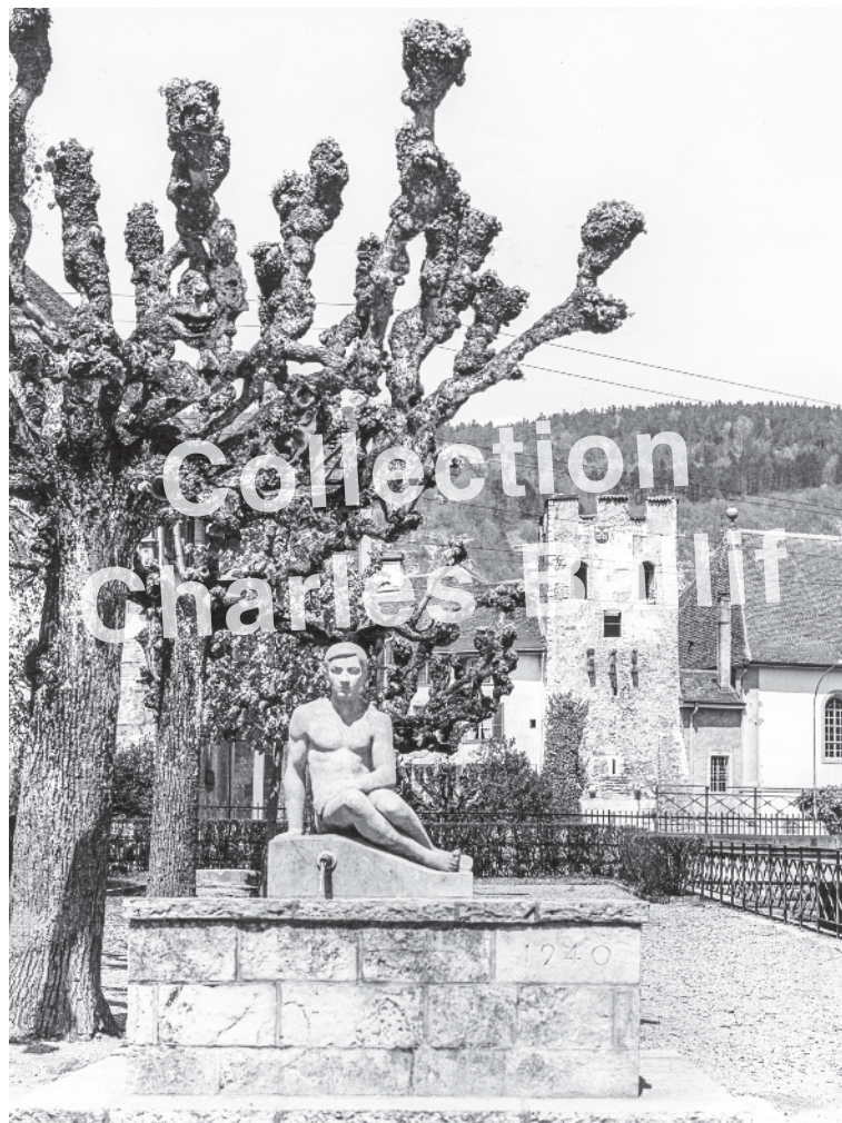
La Neuveville 1950.