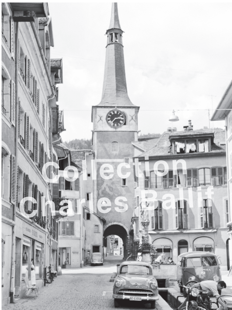
La Neuveville 1950.