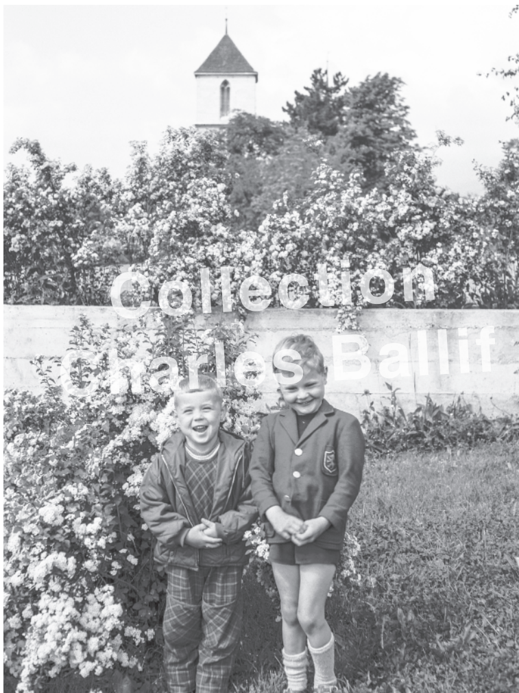
La Neuveville 1940.