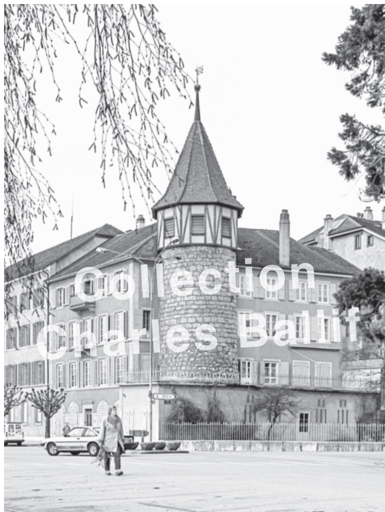
La Neuveville 1990.