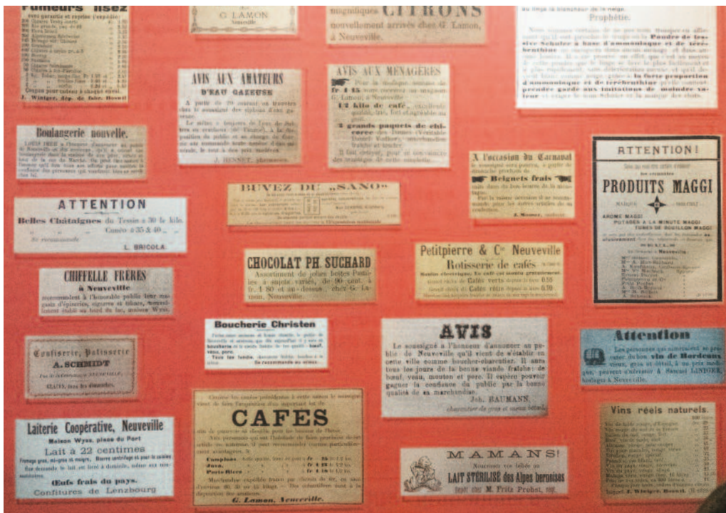
Les petites annonces, un reflet de la vie sociétale de l'époque.

Toujours compulsées avidement pour autant que l'on soit à la recherche d'un appartement, d'un véhicule ou de la personne de nos rêves, la petite annonce a toujours été source d'inspiration et objet d'attention, et pour autant que son texte ou l'image qui l'accompagne soit incongru, des pépites d'originalité et d'humour insoupçonnées.