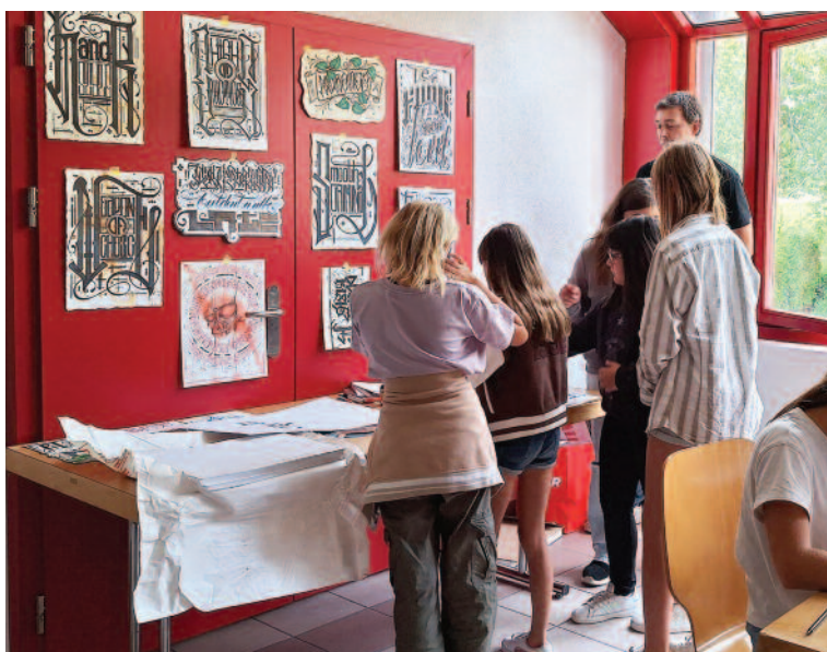
Il y avait autant de filles que de garçons aux ateliers de la Fête de la Jeunesse.