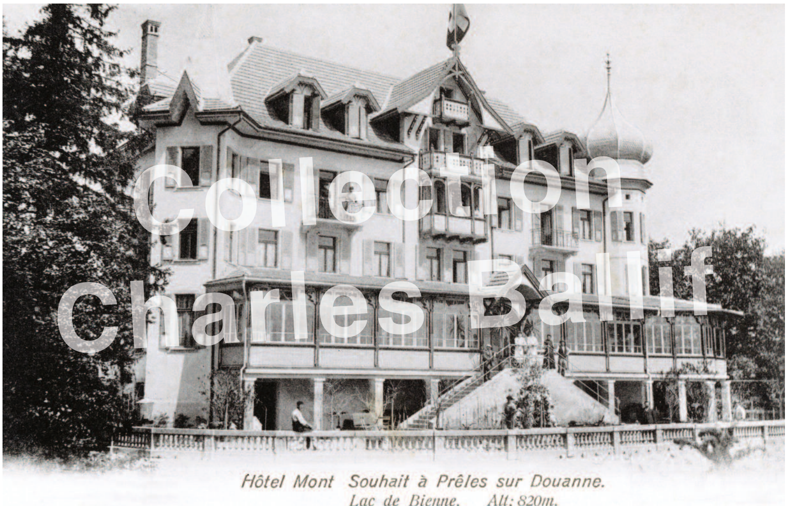
Prêles 1910, l'hôtel Mont Souhait.