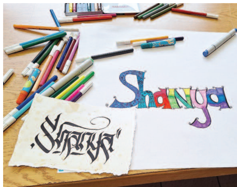
La calligraphie n'a désormais presque plus de secret pour certains.