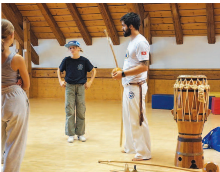
Chaque atelier a permis de s'initier à une discipline en particulier.