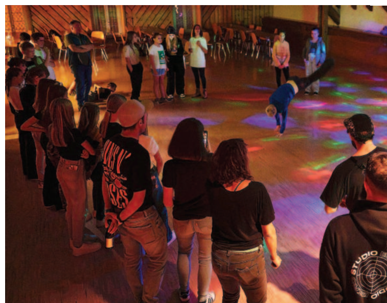
La soirée s'est terminée par une disco et des cocktails sans alcool.