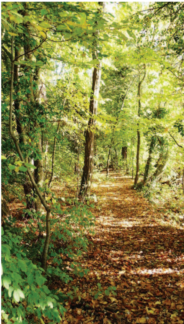
Les Larrus, une magnifique forêt riveraine qui mérite le détour !

Toponyme issu du vieux français Larris ou Lariz (bas-latin Larricum) signifiant lande, bruyère ou terrain en friche. (Source : Les lieux-dits de La Neuveville par Frédy Dubois et Charles Ballif - 2013)