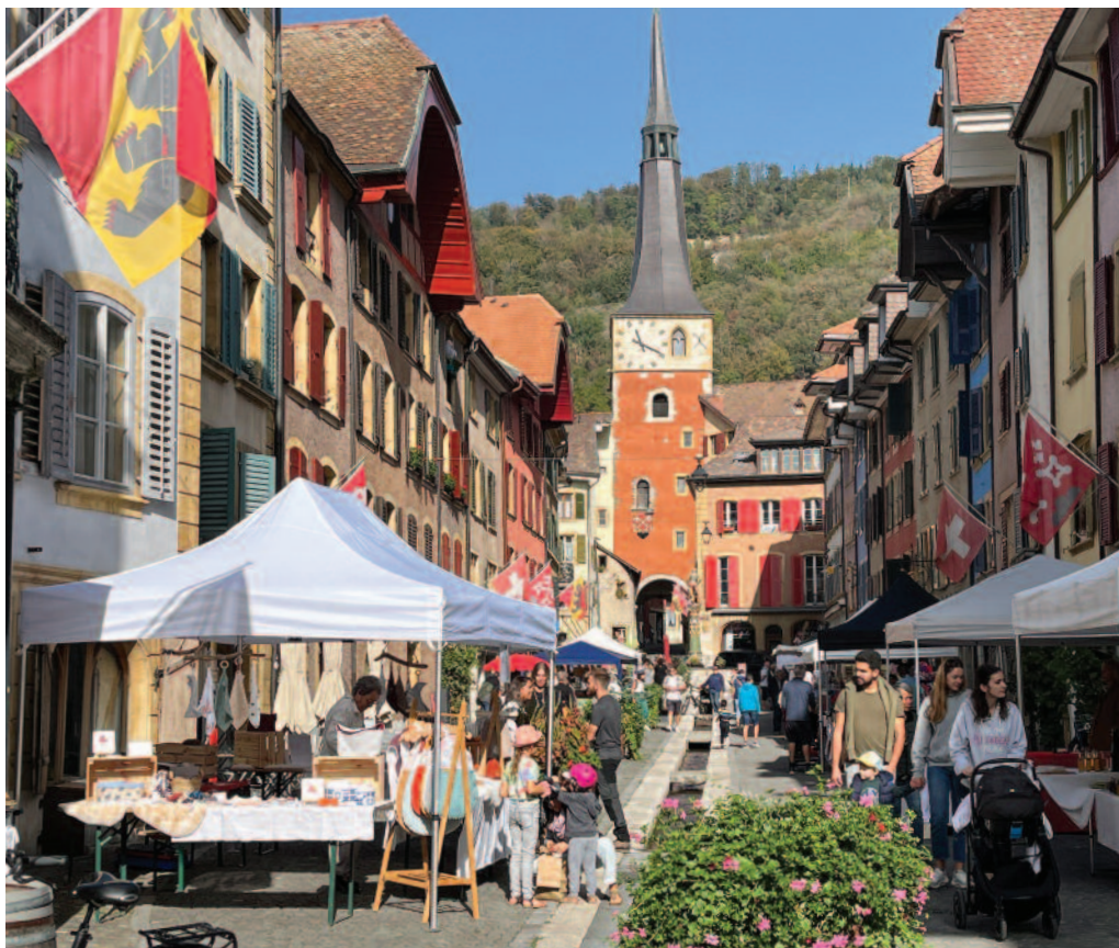
La vieille ville était baignée de soleil dimanche pour le marché LocalFusion.

Toujours très attendu et par les exposants et par les Neuvevillois, le marché de dimanche dernier en vieille ville a été l'occasion de s'offrir de jolis objets ou de déguster une spécialité d'ici ou d'ailleurs. Le temps de flâner surtout, et de prendre le temps de se retrouver, d'échanger, et de partager, de la rue du Marché à la place de la Liberté.