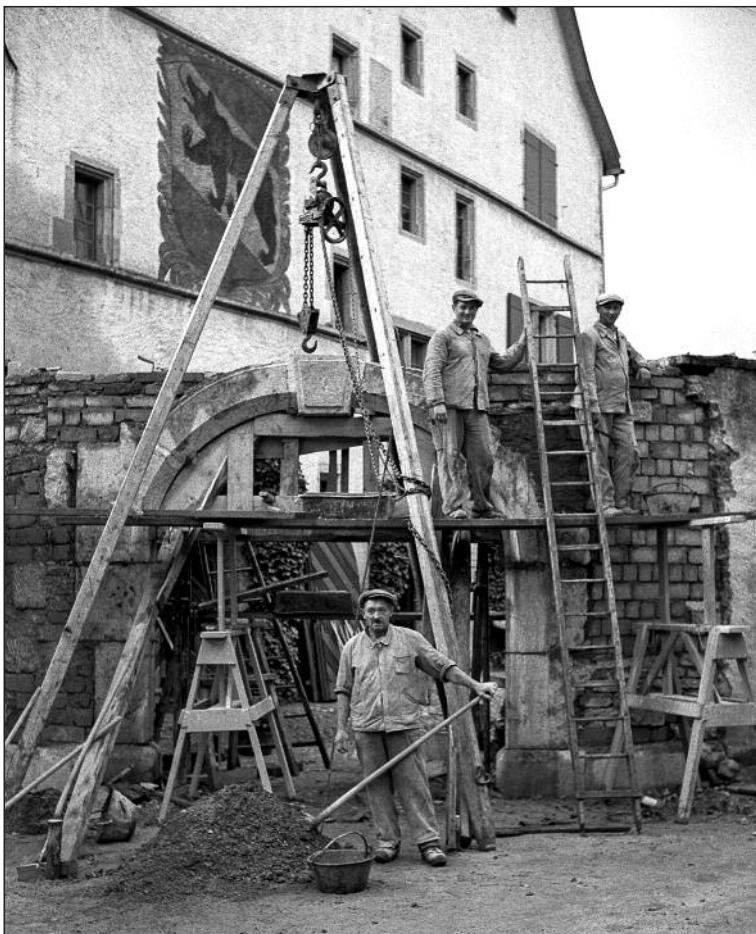
La Neuveville 1939, déplacement de la porte de la Cave de Berne.