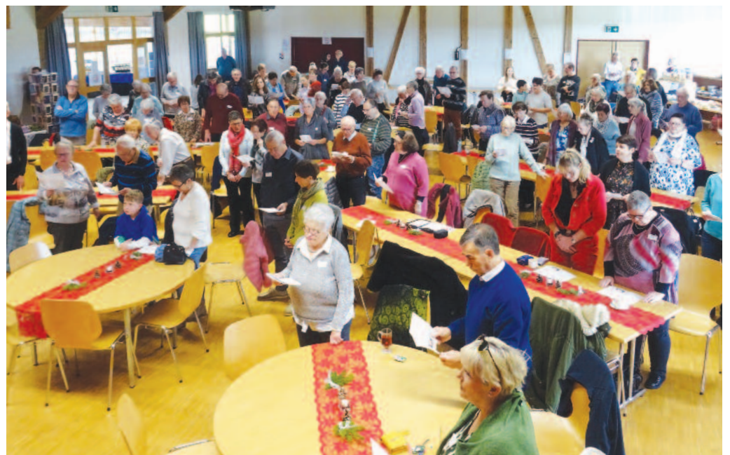
Le culte d'ouverture du marché

Premier marché de Noël à ouvrir les festivités de l'Avent, le Marché de Noël de la paroisse réformée du Plateau de Diesse a connu un vif succès, et de nombreuses personnes se sont rendues au battoir dimanche 20 novembre, que ce soit pour le culte, le brunch, ou simplement pour flâner entre les différents stands et acheter, ici ou là, un présent ou une attention pour leur prochain.