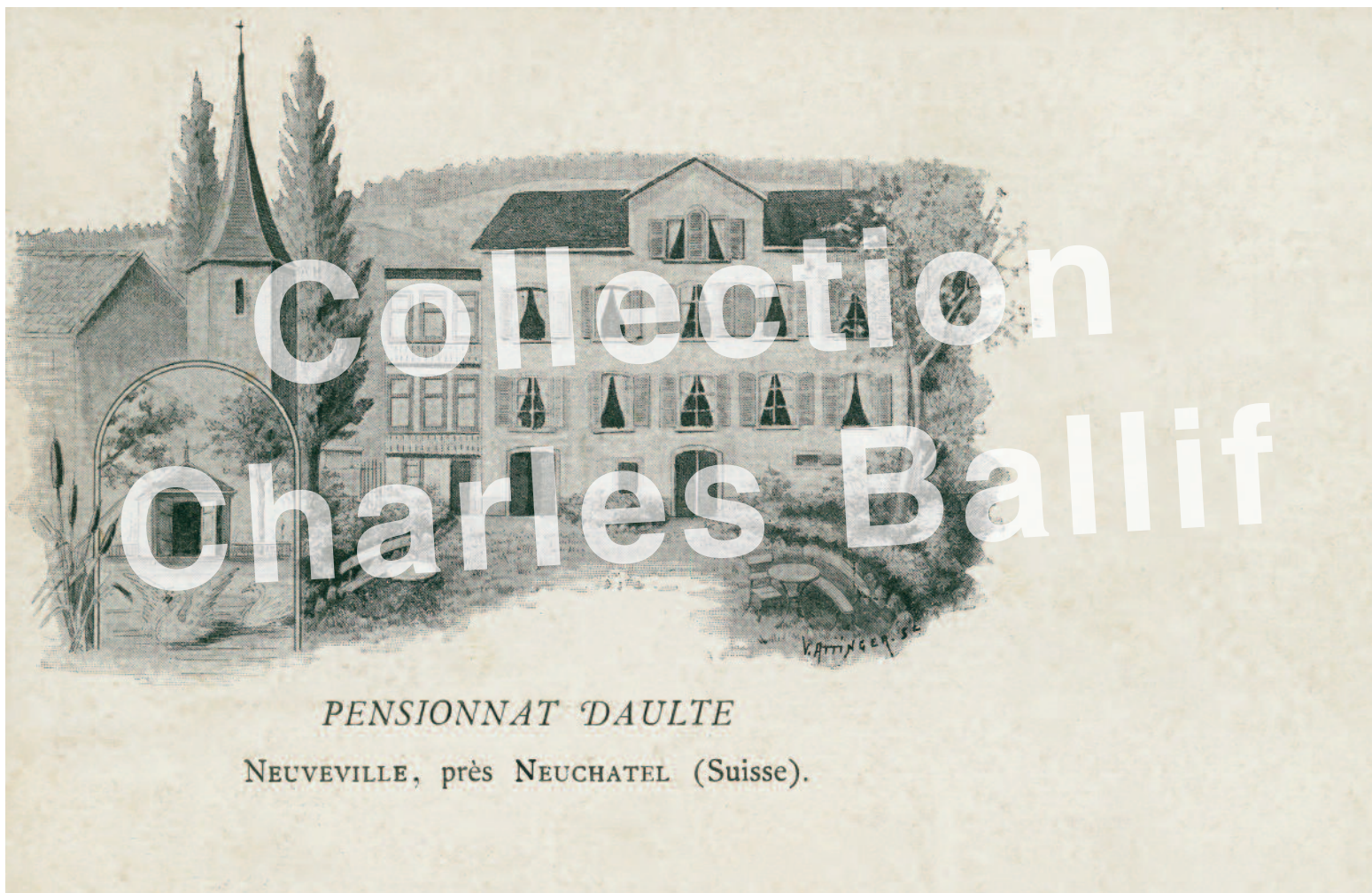
La Neuveville 1898, Pensionnat Daulte à la route de Bienne (avenue des Collonges).