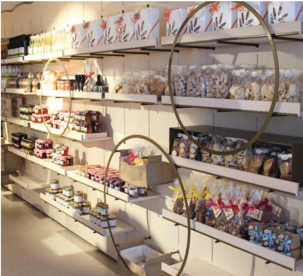
Toute la région est représentée sous diverses formes