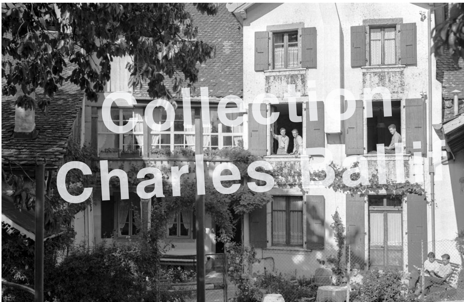
La Neuveville la pension Schenk aux Mornets.