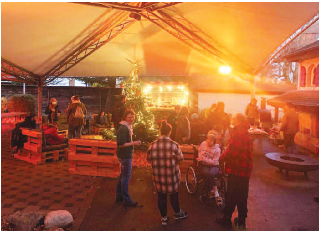
Le Foyer PTA ouvrira largement ses portes et ses ateliers à la population le 16 décembre prochain.

Poursuivant sa mission d'inclusion et décidant de convier la population neuveilloise et régionale à venir participer à ses ateliers samedi 16 décembre de 10h à 16h, le Foyer PTA-Biel ouvre largement ses portes à tout un chacun pour un moment de convivialité, de douceur, et de partage.