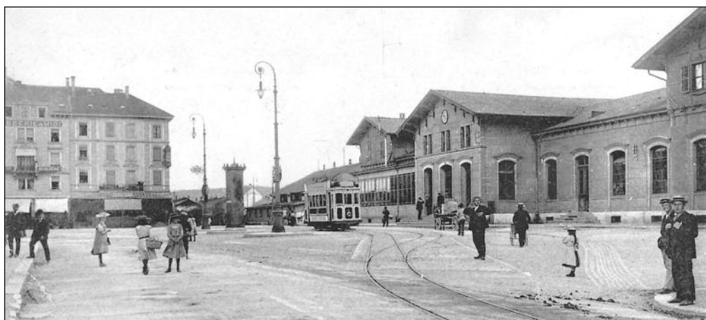
La seconde gare de Bienne aux environs de 1910

Prix de vente : CHF 20.- + frais de port INTERVALLES / Mélissa Hotz Case postale 7073 / 2500 Bienne 7 Tél. +41 79 935 66 31