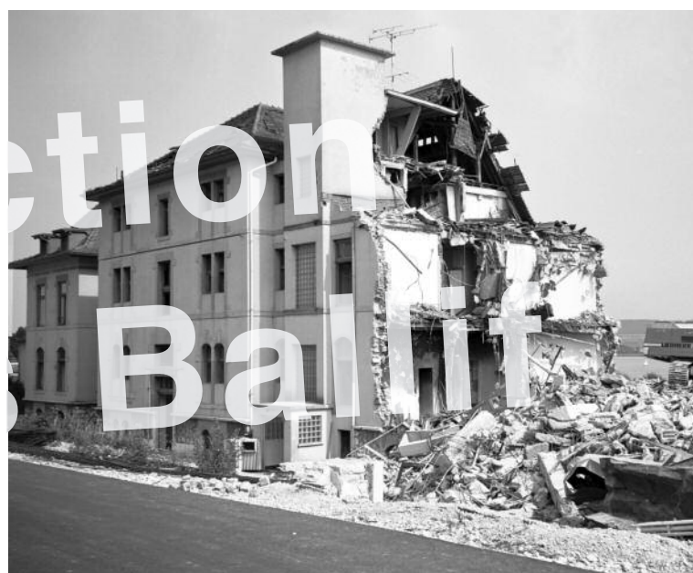
La Neuveville 1989, démolition de Mon Repos