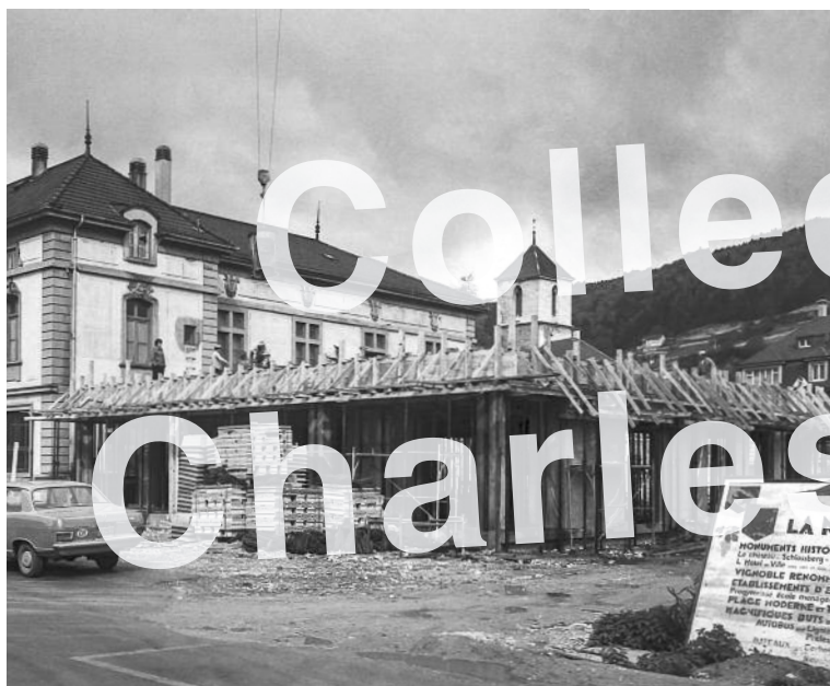
La Neuveville 1973, construction de la nouvelle poste.