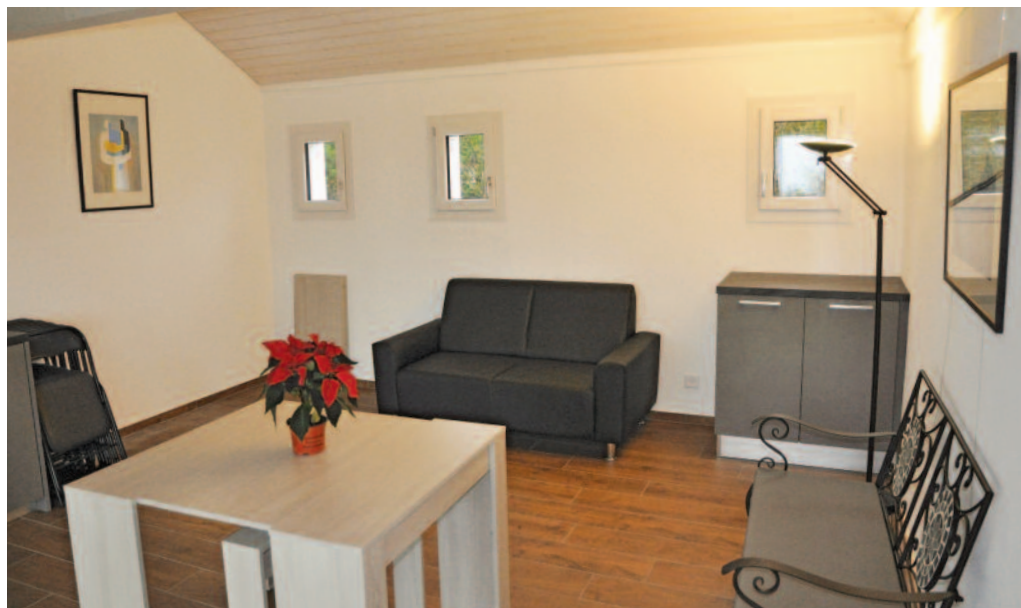
Le pavillon rénové du cimetière de La Neuveville, un lieu de paix et de souvenir, adapté aux besoins modernes de la communauté.

Depuis peu, le cimetière de La Neuveville s'est transformé en un lieu de recueillement modernisé et dans les respects des convictions de chacun, grâce à un projet de rénovation qui a permis de réaménager les lieux et d'offrir un cadre différent au Jardin du Souvenir. Un pavillon entièrement remis à neuf donc et un Jardin du Souvenir revisité offrent désormais un cadre apaisant et digne aux familles venant rendre hommage à leurs défunts.