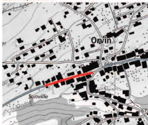
Fermeture au trafic ■ : Tronçon concerné

Loveresse, le 31 mars 2022 Office des ponts et chaussées