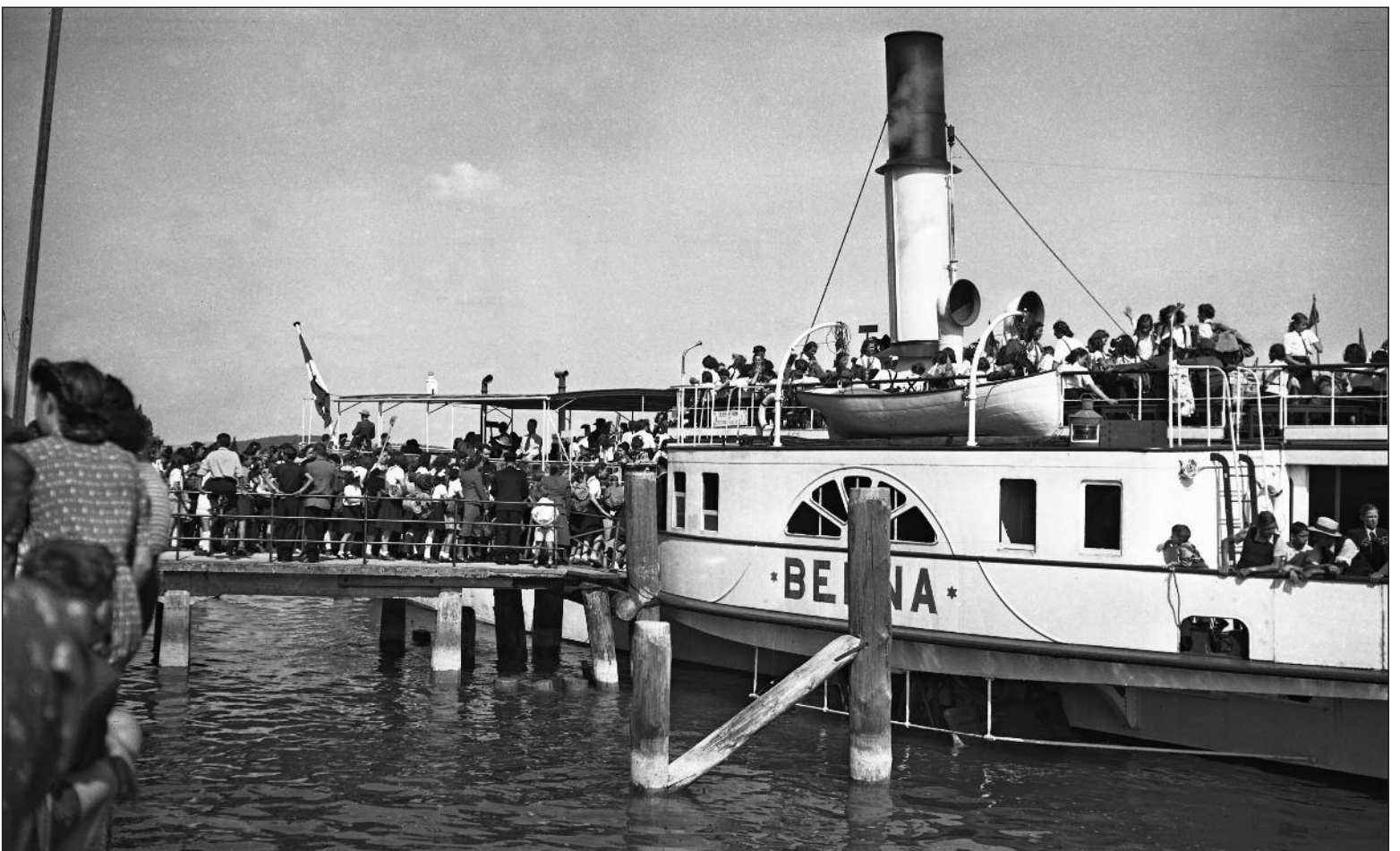
La Neuveville 1945 - Le Berna au port.