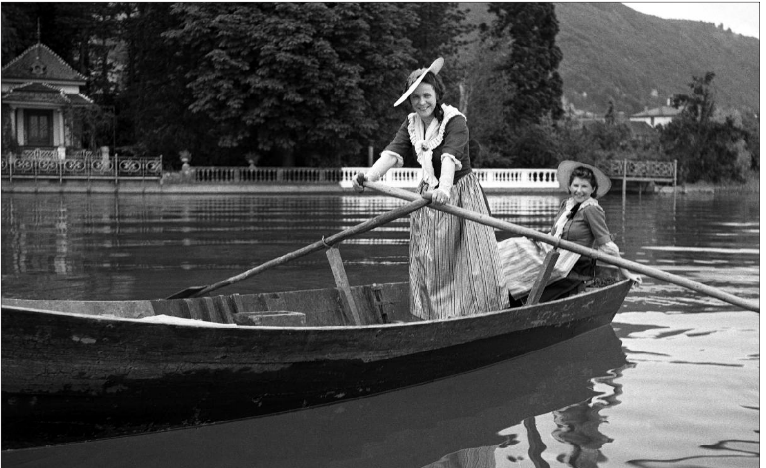
La Neuveville 1939 - Les Costumes Neuchâtelois.