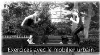
Exercices avec le mobilier urbain

Pour vous convaincre que ce cours est fait pour vous, venez déjà essayer le concept gratuitement le samedi 2 mai 2015 !