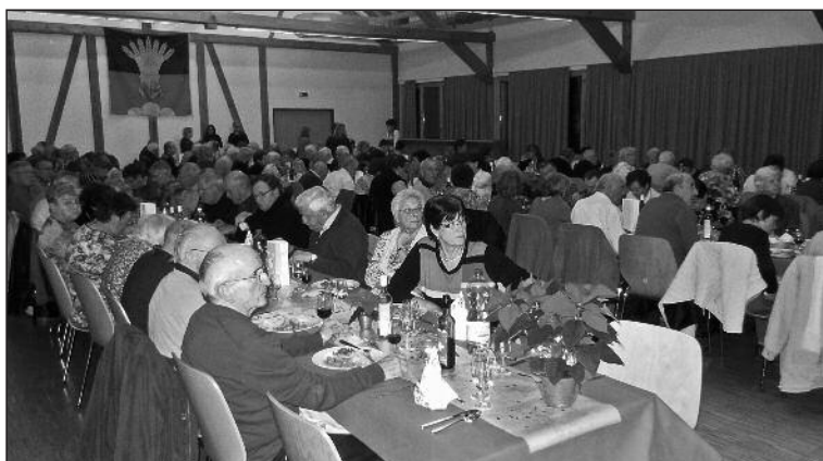
Le programme était des plus riches pour animer le Noël des aînés qui a eu lieu mercredi 11 décembre au Battoir de Diesse

Venus des trois villages tout prochainement fusionnés, ils ont été près de 150 à répondre à l'invitation des autorités. Beaucoup de musique au menu, à commencer par plus de 60 enfants des différentes classes de l'école du Plateau de Diesse. Ils ont apporté spontanéité et fraîcheur et les yeux pleins de lumières, ils ont interprété plusieurs chants très appréciés. La fanfare de Nods-Diesse s'est également produite, de même qu'un ensemble de cor des Alpes.